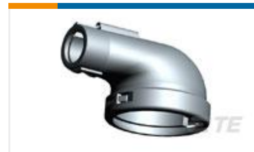
TE 产品编号1-1718284-2 ADAPTER 90° FOR 10-14 POS. SOCKET