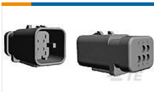
TE 产品编号776537-3 AS 16, 6P CAP ASSY, RD, KEY 3