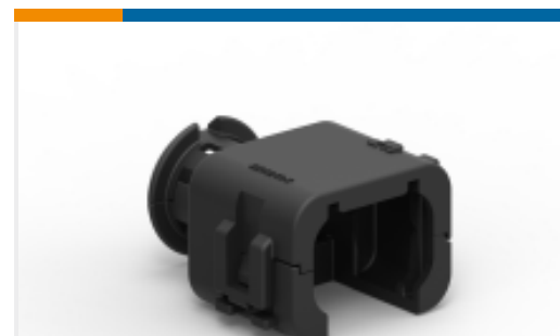
TE 产品编号2292797-1 AS16 BACKSHELL, 2P PLUG, SMOOTH EXIT, MC