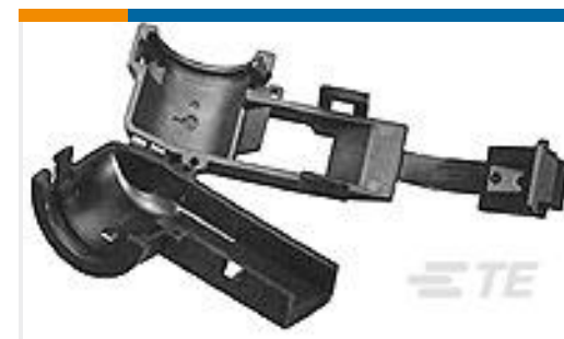
TE 产品编号1418919-1 MULTI CORE CABLE ADAPTER 90 DEGREE