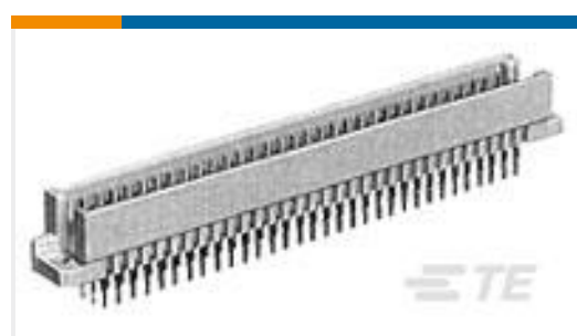
TE 产品编号5650918-5 ASSY, PIN, EUROCARD, TYPE R/2, LEA