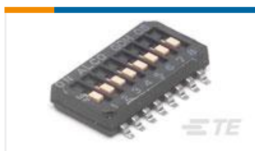
TE 产品编号1-1571983-1 GDH08STR04=DIP SWITCH