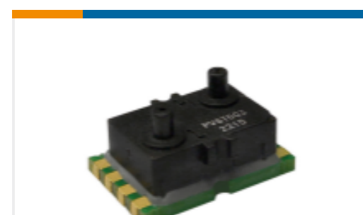
TE 产品编号20021491-00 LMIS250UB3S; PRES; 0...250Pa; I2C; 3V