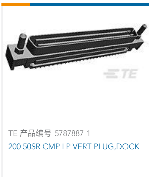
TE 产品编号 5787887-1 200 50SR CMP LP VERT PLUG,DOCK