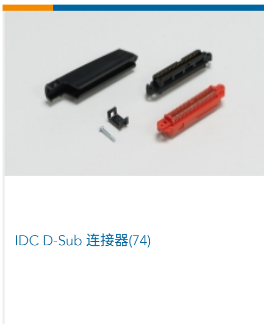
IDC D-Sub 连接器(74)