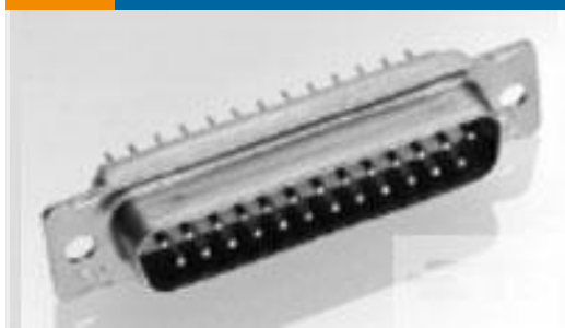
TE 产品编号1218125-4 37 POS,ASSY,PLUG,LOW PROF,109