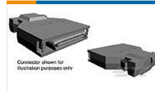
TE 产品编号787229-1 68 .8MM CHAMP BACKSHELL KIT