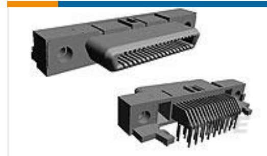
TE 产品编号5796055-1 68 CHAMP R/A ASSY,LC