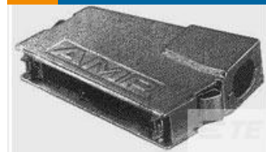
TE 产品编号5749204-2 68 50SR KIT,75D,UK