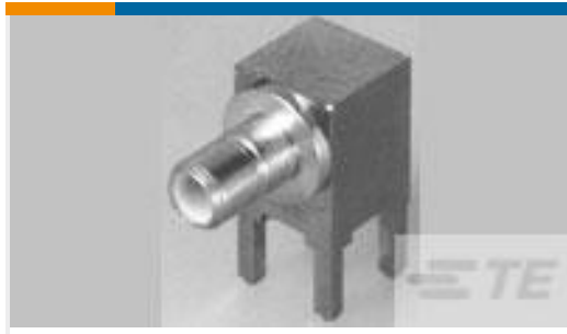
TE 产品编号414026-3 JACK ASSY,SMB,RT ANG