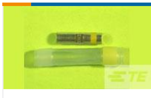
TE 产品编号650076-000 D-436-38