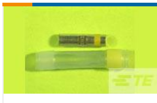
TE 产品编号650075-000 D-436-37