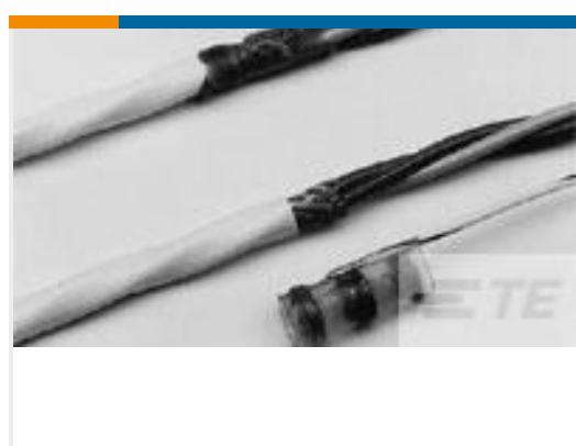
TE 产品编号169750-000 S02-09-R