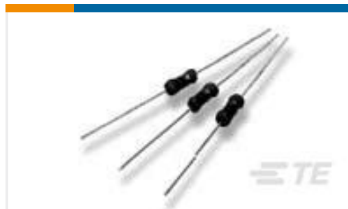
TE 产品编号4-1879353-5 RR02 5% 300K AMMO