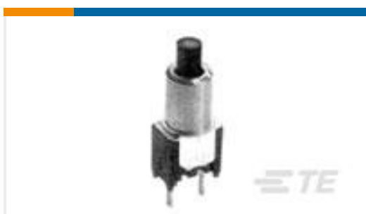
TE 产品编号4-1437572-7 TPD11CGPC0=SW P/B NO-OPEN BLAC