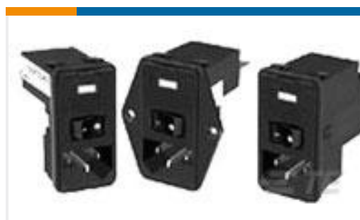
TE 产品编号4-1609155-9 PMOS0SM3E=C7113