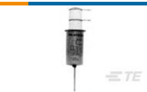
TE 产品编号1-1618239-5 K41A232=RELAY, VACUUM, SPST-NO