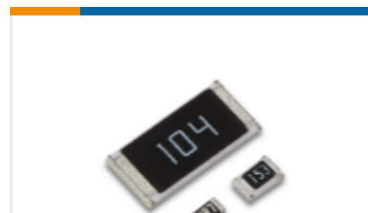
TE 产品编号5-2176339-5 CRGCQ 0603 330K 1%