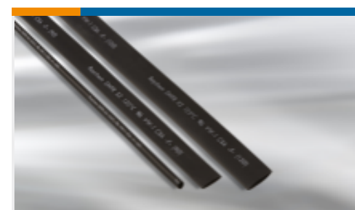
TE 产品编号EM7488-000 X2-7.0-0-SP-SM