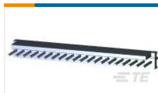
TE 产品编号2-640454-0 20P MTA100 HDR ASSY SQ STR POL