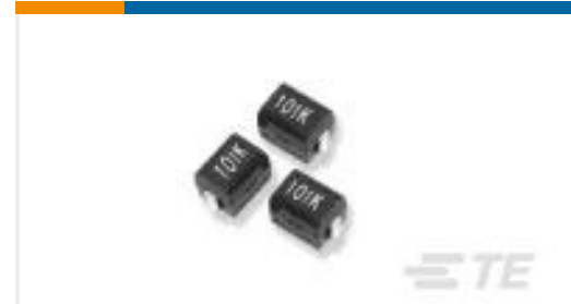
TE 产品编号1-1624094-6 3613C 47UH 10%