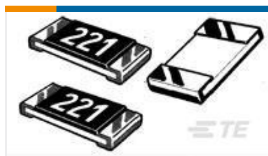
TE 产品编号5-2176070-6 3521 2K0 1% 2W