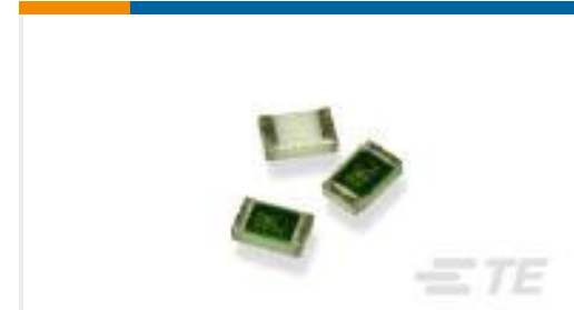
TE 产品编号9-1879208-2 CPF 0402 62K 0.1% 25PPM 1K RL