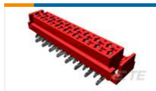
TE 产品编号8-338069-0 MICRO-MATCH SMD FTE