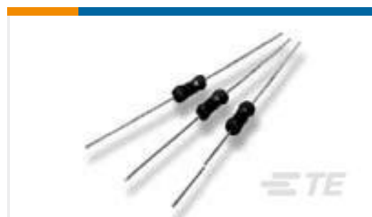
TE 产品编号3-1625890-7 2W SM M/OX 5% 27R