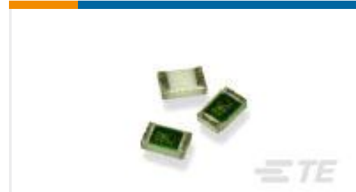
TE 产品编号6-1879208-6 CPF 0402 5K1 0.1% 25PPM 1K RL