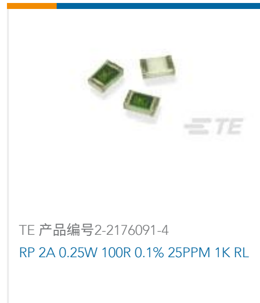
TE 产品编号2-2176091-4 RP 2A 0.25W 100R 0.1% 25PPM 1K RL