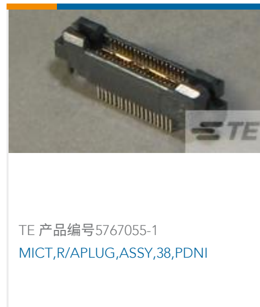
TE 产品编号5767055-1 MICT,R/APLUG,ASSY,38,PDNI