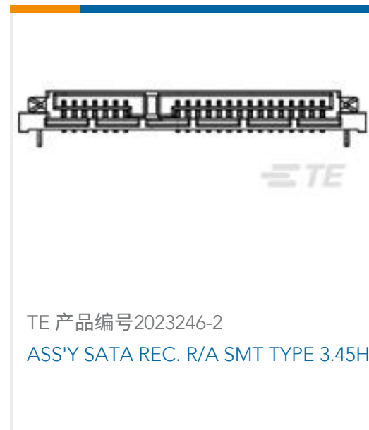
TE 产品编号2023246-2 ASS'Y SATA REC. R/A SMT TYPE 3.45H