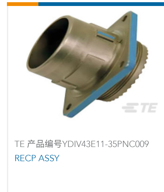
TE 产品编号YDIV43E11-35PNC009 RECP ASSY