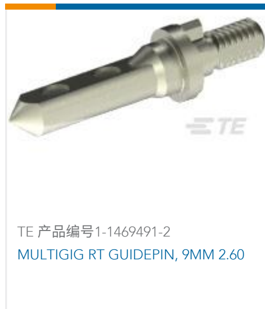
TE 产品编号1-1469491-2 MULTIGIG RT GUIDEPIN, 9MM 2.60