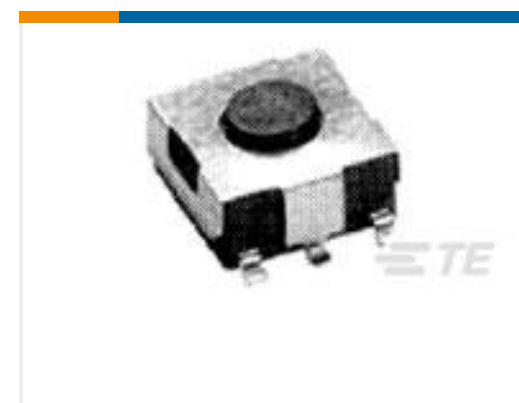
TE 产品编号1-1437565-9 FSM1LPTR=NEW P/N