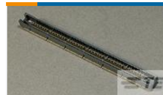
TE 产品编号5767054-6 MICT,RECPT,228,ASSY,PDNI