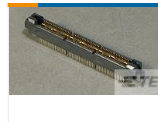
TE 产品编号5767006-3 MICT,R/APLUG,114,ASY,.025,.062