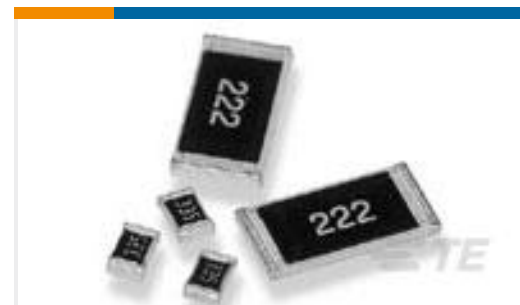
TE 产品编号1-1625873-4 0402 1% LAB-KIT