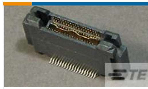
TE 产品编号 5767121-8 MICT,PLG,038,ASY,.025,TAPE PKG