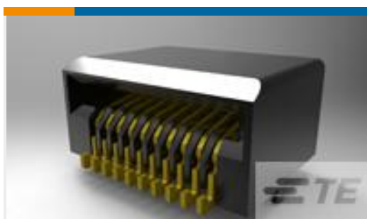
TE 产品编号 2170088-1 ZSFP+ Connector,30u"