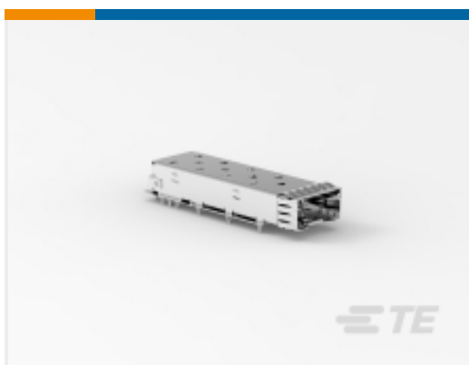
TE 产品编号 2274001-1 ZSFP+ 1X1 CAGE ASSEMBLY PRESSFIT