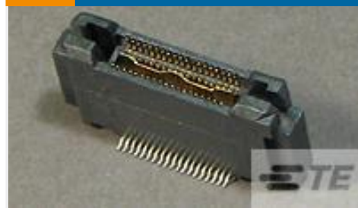
TE 产品编号 5767149-8 MICTOR PLUG ASSY IN TAPE & REE