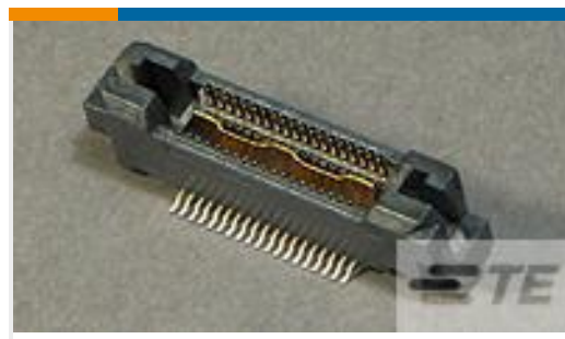
TE 产品编号 5767119-1 MICT,PLG,038,ASY,.025,TAPE PKG