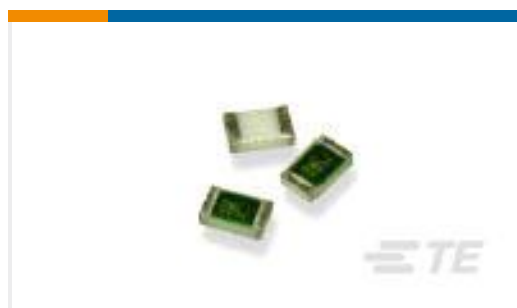
TE 产品编号 3-1879208-6 CPF 0402 300R 0.1% 25PPM 1K RL