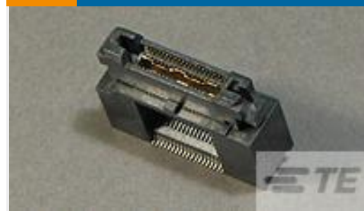
TE 产品编号 5767042-1 MICT,738PLUG,038,ASSY,.025,EXT