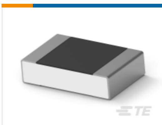
TE 产品编号 4-2176378-4 RQ 0805 28R 0.1% 10PPM 5K RL