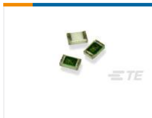
TE 产品编号 9-1879208-7 CPF 0402 100K 0.1% 25PPM 1K RL