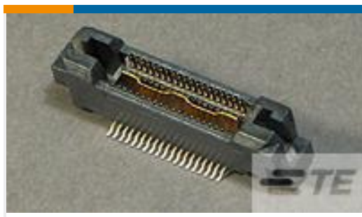
TE 产品编号 5767118-8 MICT,PLG,038,ASY,.025,TAPE PKG