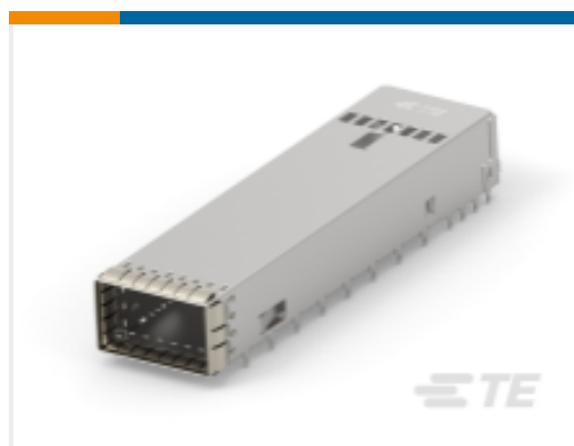
TE 产品编号 2317416-1 OSFP 1X1 CAGE ASSEMBLY