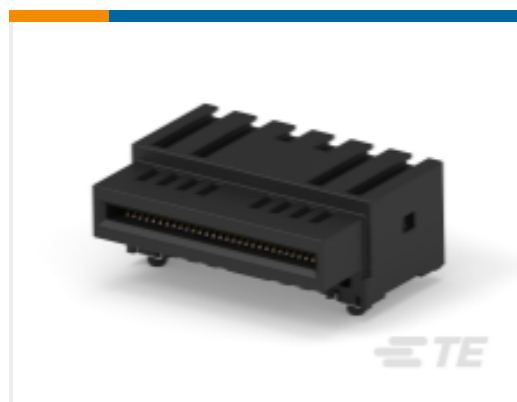
TE 产品编号 2344064-4 CONNECTOR ASSEMBLY, SMT, OSFP 112