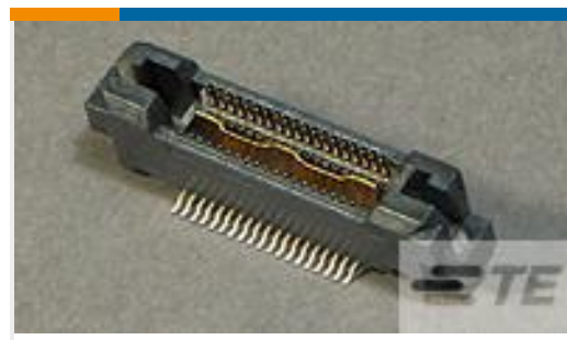
TE 产品编号 5767119-8 MICT,PLG,038,ASY,.025,TAPE PKG