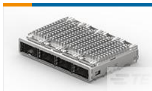
TE 产品编号 2227249-2 1x4 Cage Assy Bhd Bzl QSFP28