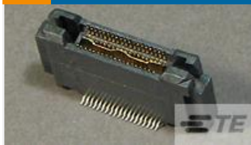
TE 产品编号 5767149-1 MICTOR PLUG ASSY IN TAPE & REE