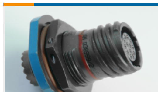
TE 产品编号YDTS24W09-98SNV001 RECP ASSY