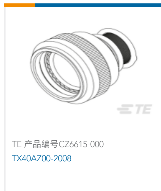
TE 产品编号CZ6615-000 TX40AZ00-2008