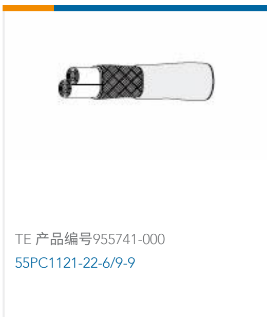
TE 产品编号955741-000 55PC1121-22-6/9-9