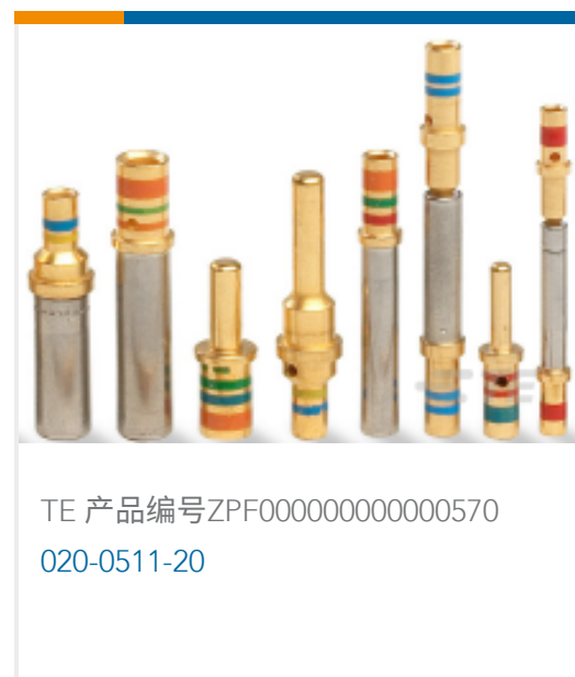
TE 产品编号ZPF000000000000570 020-0511-20