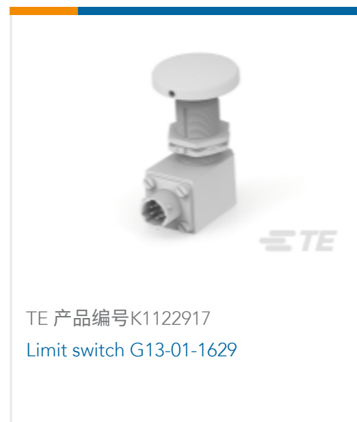
TE 产品编号K1122917 Limit switch G13-01-1629