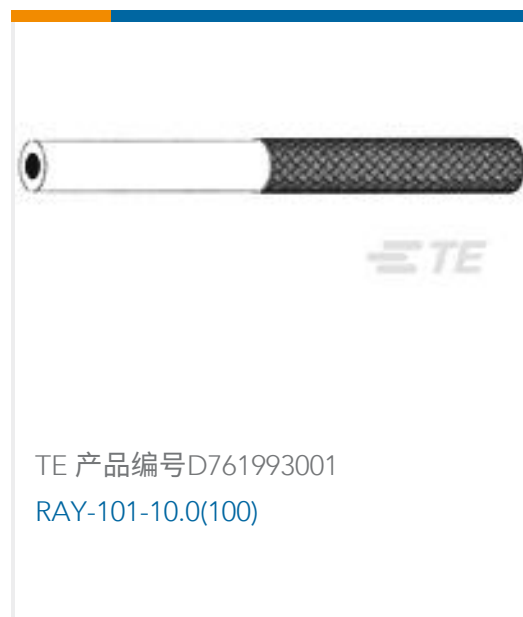
TE 产品编号D761993001 RAY-101-10.0(100)