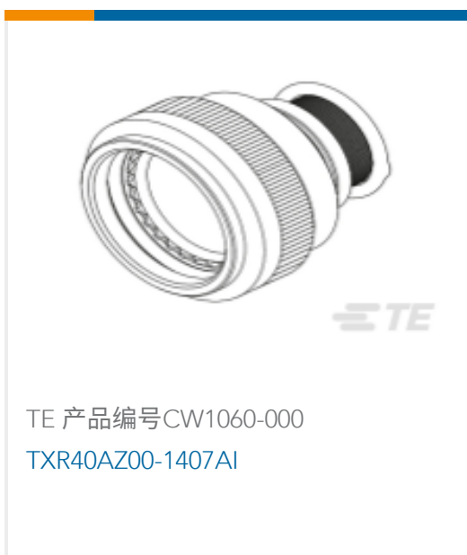
TE 产品编号CW1060-000 TXR40AZ00-1407AI