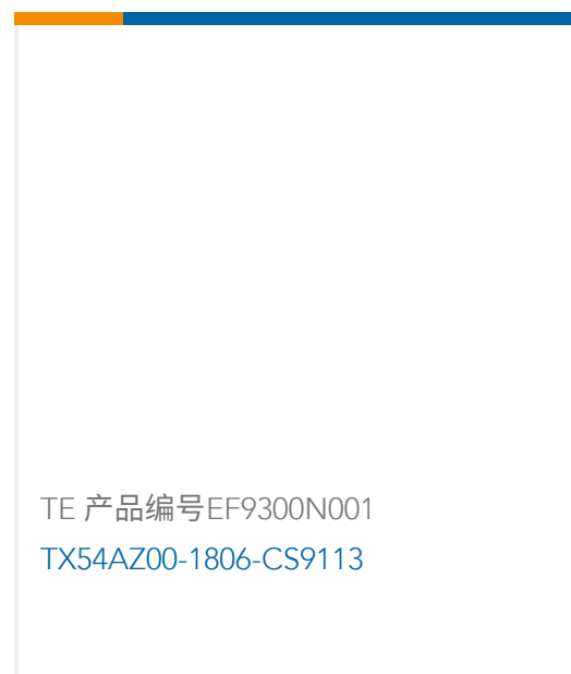
TE 产品编号EF9300N001 TX54AZ00-1806-CS9113