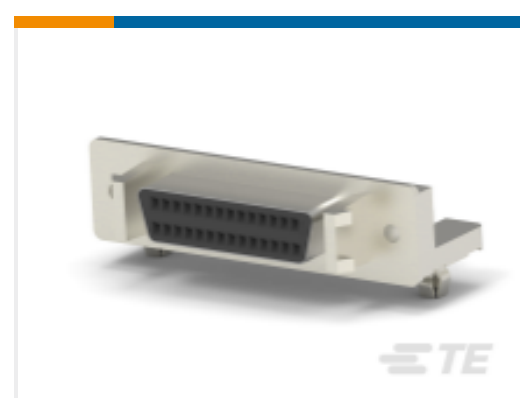
TE 产品编号 CAT-018-DRARA127 D-Sub 插座组件：直角，1.27mm