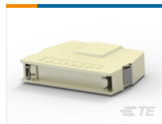
TE 产品编号 5749193-1 50 50SR KIT,ST,UK