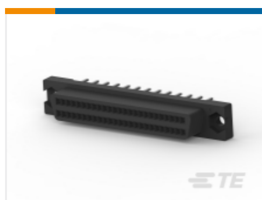
TE 产品编号 CAT-020-ADRV127 AMPLIMITE D-Sub 插座组件：垂直，1.27mm