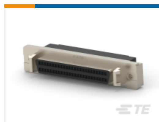
TE 产品编号 CAT-AM7-436507 IDC D-Sub：插座套件，面板安装，信号，1.27mm