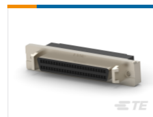
TE 产品编号 CAT-AM7-436507 IDC D-Sub：插座组件、面板安装，信号，1.27mm