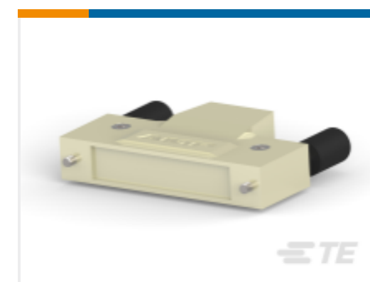
TE 产品编号 5749080-1 50 50SR BSHLL KIT,M/J-SCR