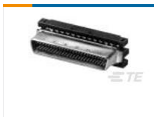
TE 产品编号 5749110-1 50 50SR CABLE PLUG SUB-ASSY