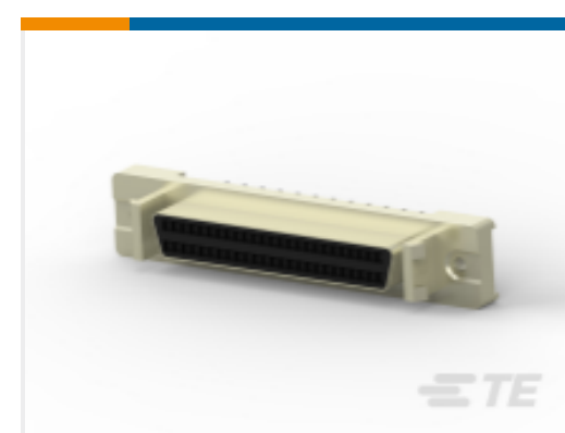
TE 产品编号 CAT-020-DRAVAP127 D-Sub 插座组件：垂直，Action Pin，1.27mm