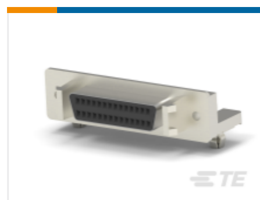
TE 产品编号 CAT-018-DRARA127 D-Sub 插座组件：直角，1.27mm