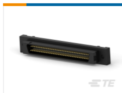
TE 产品编号 2-5174339-5 AMPLIMITE CAP HEADER