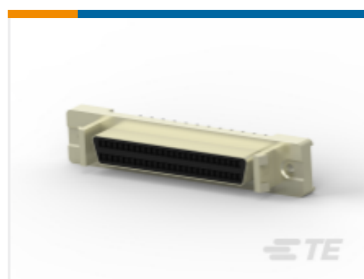
TE 产品编号 CAT-020-DRAVAP127 D-Sub 插座组件：垂直，Action Pin，1.27mm