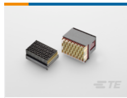
TE 产品编号2302791-1 VERTRECCASSY,CENTER,RTM, MULTIGIG RT3