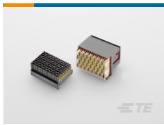
TE 产品编号2302785-2 RA PLUG ASSY,7ROW,CENTER,VPX, MG RT3