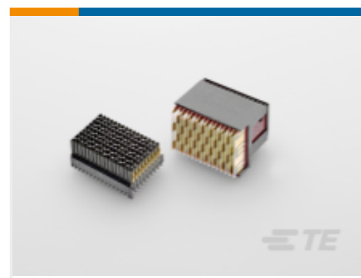
TE 产品编号2302789-1 VERTRECCASSY,CENTER,MULTIGIG RT3