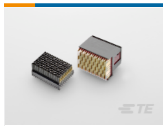
TE 产品编号2302790-1 VERTRECCASSY,RIGHTEND,MULTIGIG RT3