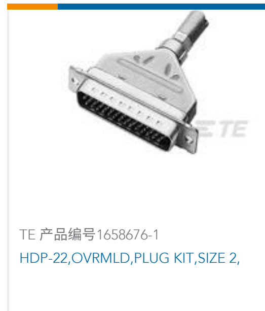
TE 产品编号1658676-1 HDP-22,OVRMLD,PLUG KIT,SIZE 2,