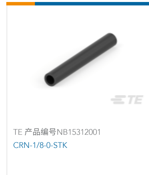
TE 产品编号NB15312001 CRN-1/8-0-STK