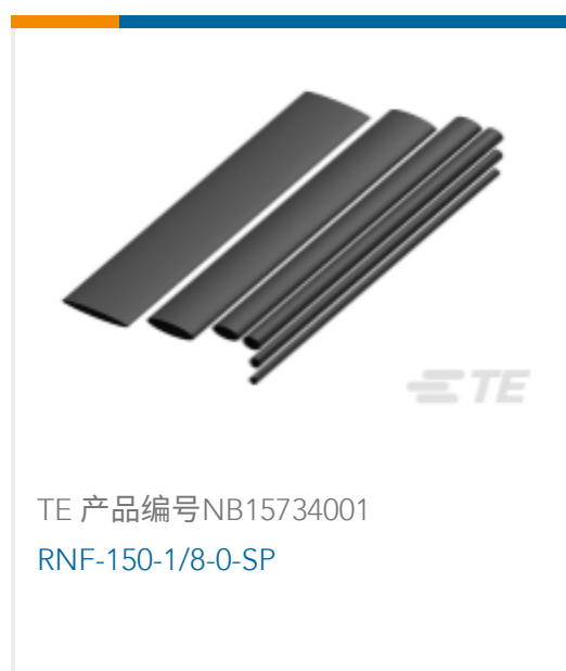
TE 产品编号NB15734001 RNF-150-1/8-0-SP