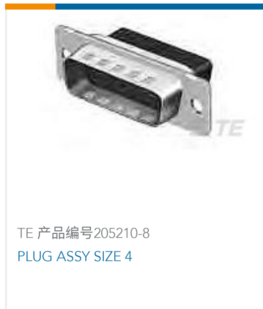
TE 产品编号205210-8 PLUG ASSY SIZE 4