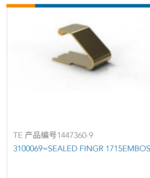
TE 产品编号1447360-9 3100069=SEALED FINGR 1715EMBOS