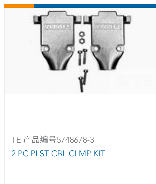
TE 产品编号5748678-3 2 PC PLST CBL CLMP KIT