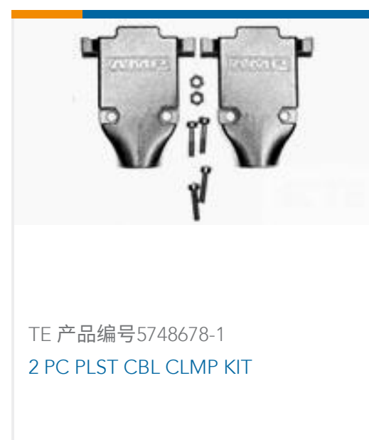
TE 产品编号5748678-1 2 PC PLST CBL CLMP KIT