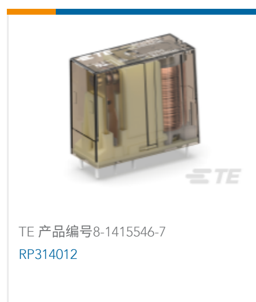
TE 产品编号8-1415546-7 RP314012