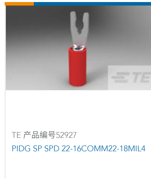
TE 产品编号52927 PIDG SP SPD 22-16COMM22-18MIL4