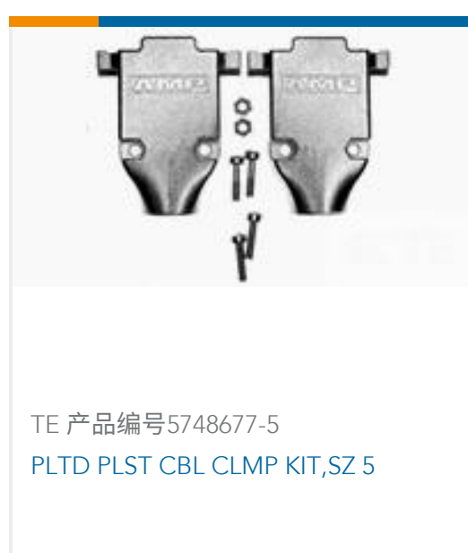
TE 产品编号5748677-5 PLTD PLST CBL CLMP KIT,SZ 5