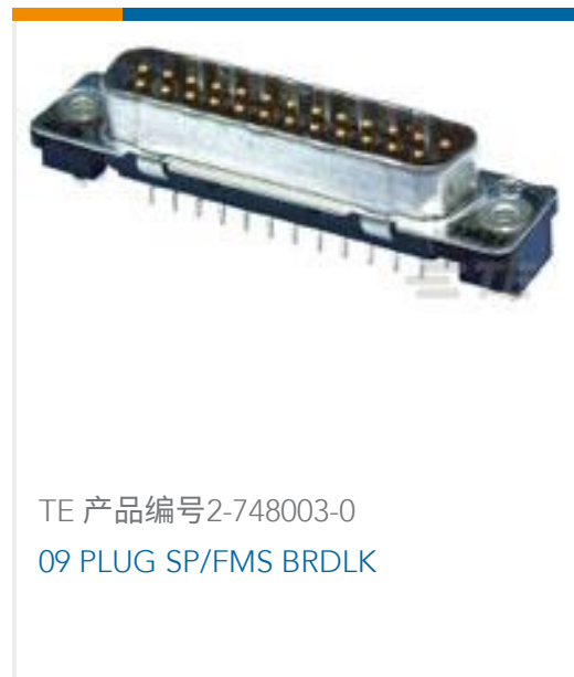
TE 产品编号2-748003-0 09 PLUG SP/FMS BRDLK