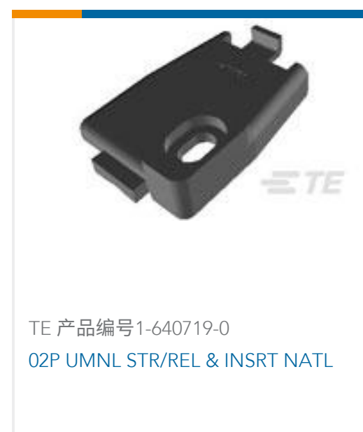
TE 产品编号1-640719-0 02P UMNL STR/REL & INSRT NATL