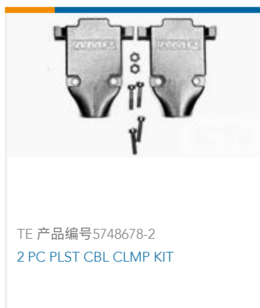
TE 产品编号5748678-2 2 PC PLST CBL CLMP KIT