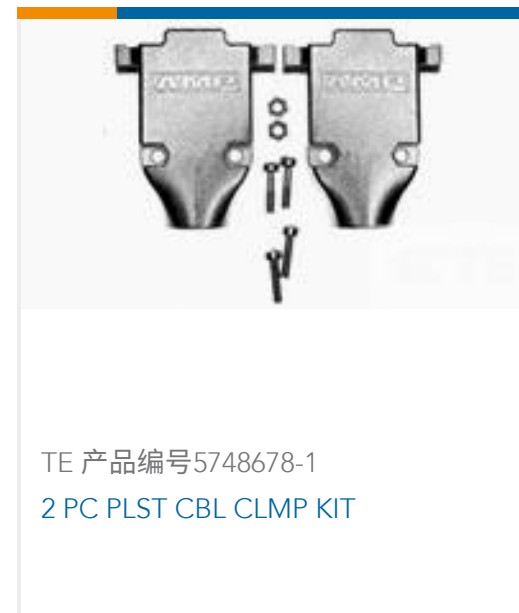
TE 产品编号5748678-1 2 PC PLST CBL CLMP KIT