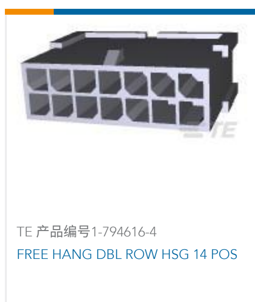
TE 产品编号1-794616-4 FREE HANG DBL ROW HSG 14 POS