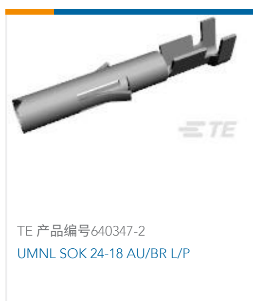
TE 产品编号640347-2 UMNL SOK 24-18 AU/BR L/P