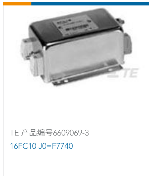
TE 产品编号6609069-3 16FC10 J0=F7740