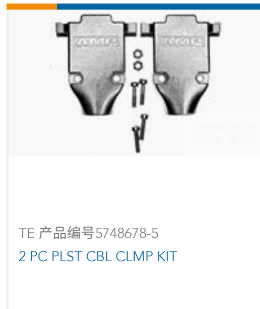
TE 产品编号5748678-5 2 PC PLST CBL CLMP KIT