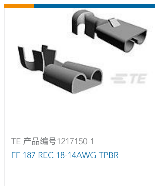
TE 产品编号1217150-1 FF 187 REC 18-14AWG TPBR