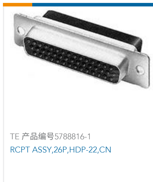
TE 产品编号5788816-1 RCPT ASSY,26P,HDP-22,CN