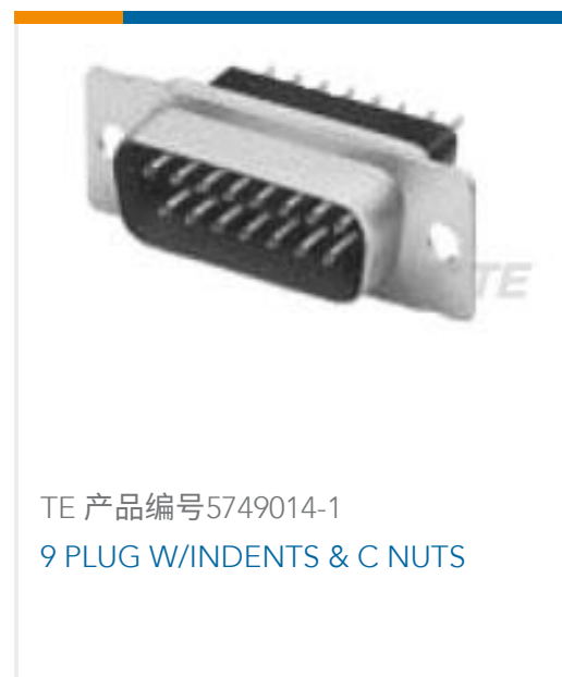
TE 产品编号5749014-1 9 PLUG W/INDENTS & C NUTS