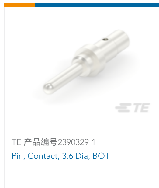
TE 产品编号2390329-1 Pin, Contact, 3.6 Dia, BOT