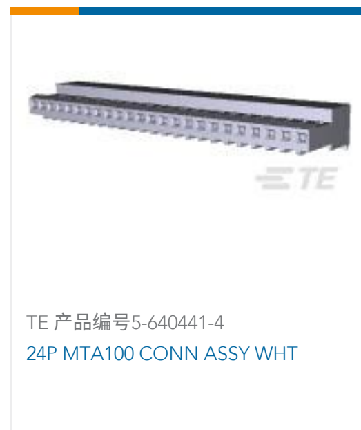
TE 产品编号5-640441-4 24P MTA100 CONN ASSY WHT