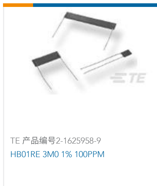
TE 产品编号2-1625958-9 HB01RE 3M0 1% 100PPM