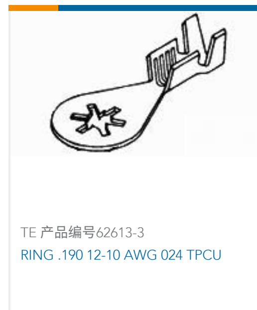
TE 产品编号62613-3 RING .190 12-10 AWG 024 TPCU