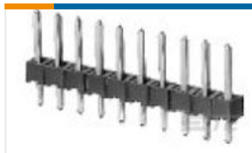
TE 产品编号5-146277-6 06 MODII HDR SRST B/A .100CL