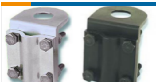
TE 产品编号LBMB9034-L MOUNT, MIR, 3/4 BLK, STD, 90DEG