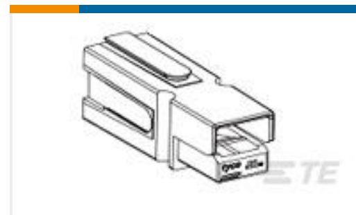
TE 产品编号1445715-4 75A HSG SUBASY GREEN