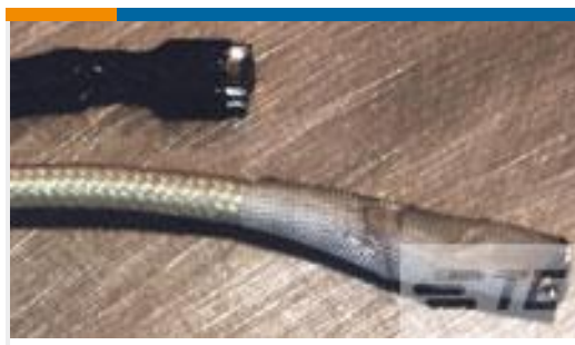
TE 产品编号7536494002 RT555-1/8-0-SP