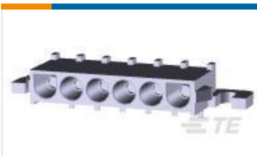
TE 产品编号643235-1 06P UMNHL HDR ASSY R/A NATL