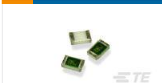
TE 产品编号3-1879215-0 CPF 0402 8K25 0.1% 25PPM 1K RL