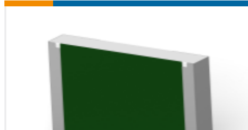
TE 产品编号9-2176401-5 3540 100R 5%