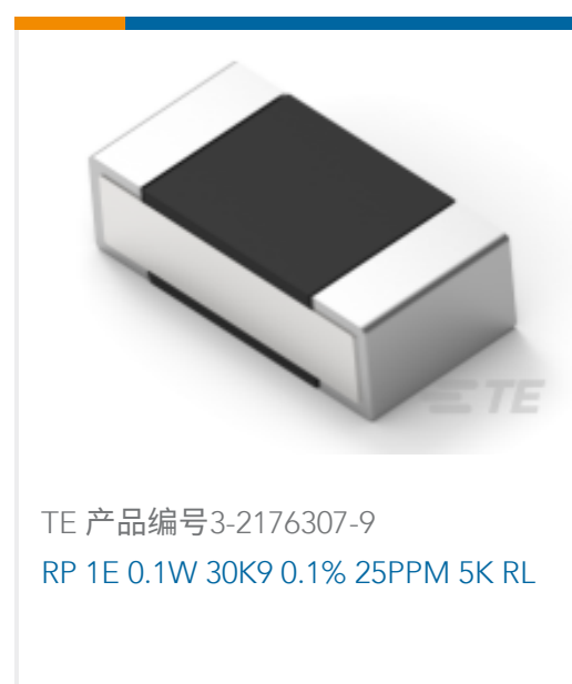
TE 产品编号 3-2176307-9 RP 1E 0.1W 30K9 0.1% 25PPM 5K RL