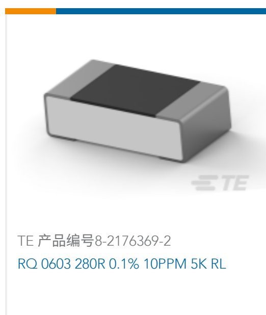
TE 产品编号 8-2176369-2 RQ 0603 280R 0.1% 10PPM 5K RL