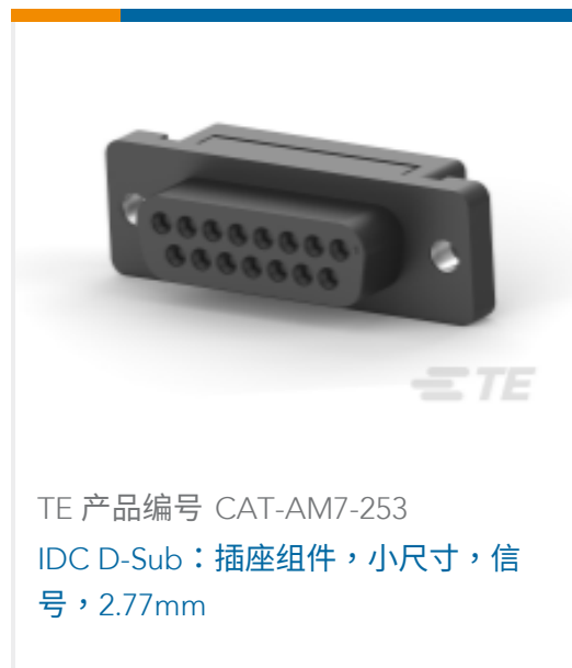
TE 产品编号 CAT-AM7-253 IDC D-Sub：插座组件，小尺寸，信号，2.77mm