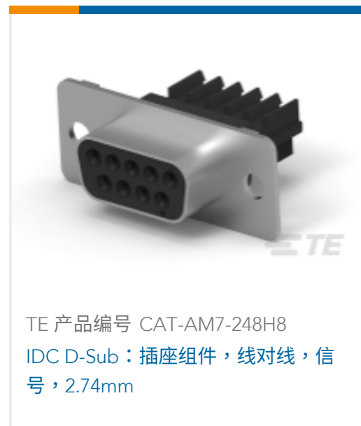
TE 产品编号 CAT-AM7-248H8 IDC D-Sub：插座组件，线对线，信号，2.74mm