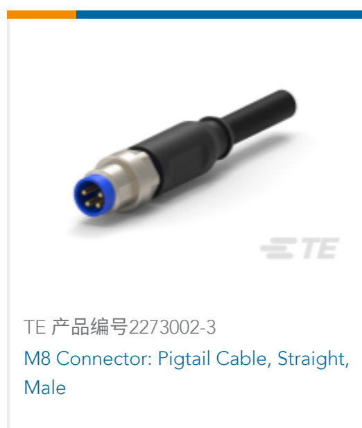
TE 产品编号 2273002-3 M8 Connector: Pigtail Cable, Straight, Male