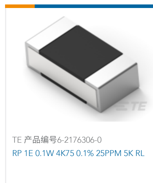
TE 产品编号 6-2176306-0 RP 1E 0.1W 4K75 0.1% 25PPM 5K RL