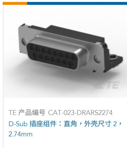
TE 产品编号 CAT-023-DRARS2274 D-Sub 插座组件：直角，外壳尺寸 2，2.74mm