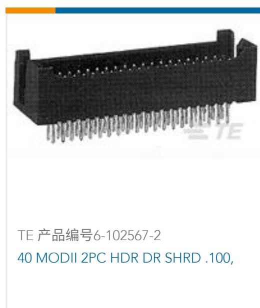
TE 产品编号 6-102567-2 40 MODII 2PC HDR DR SHRD .100,