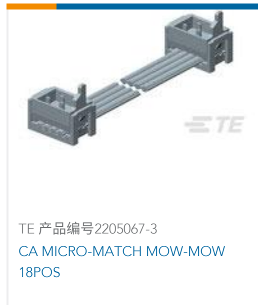
TE 产品编号2205067-3 CA MICRO-MATCH MOW-MOW 18POS