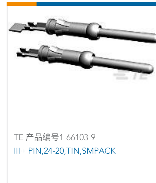
TE 产品编号1-66103-9 III+ PIN,24-20,TIN,SMPACK 18POS