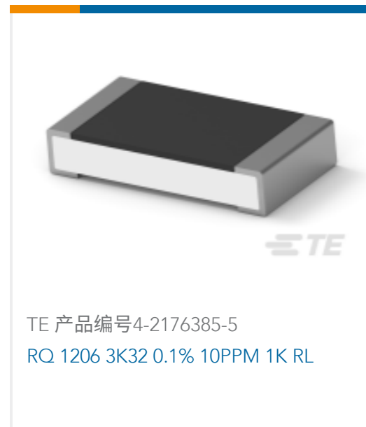
TE 产品编号4-2176385-5 RQ 1206 3K32 0.1% 10PPM 1K RL