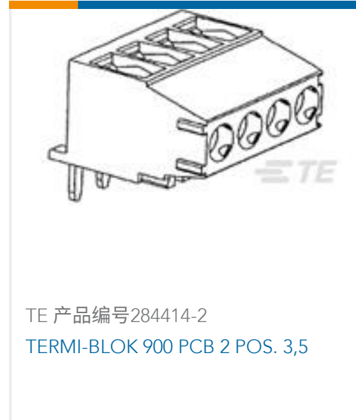
TE 产品编号284414-2 TERMI-BLOK 900 PCB 2 POS. 3,5