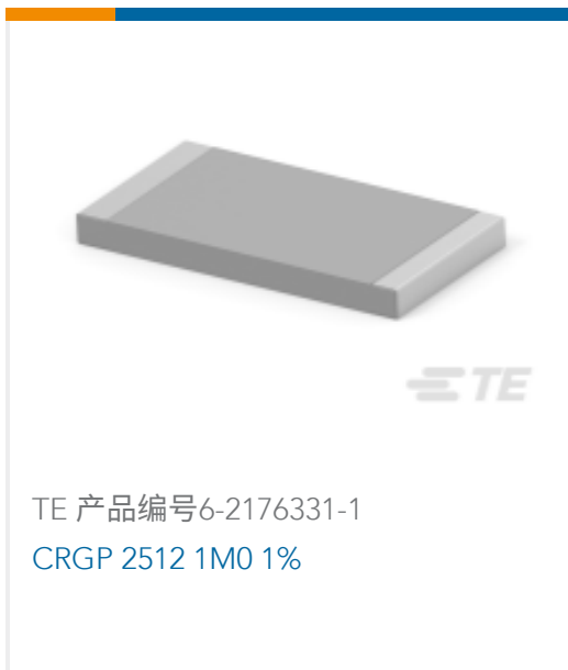
TE 产品编号6-2176331-1 CRGP 2512 1M0 1%