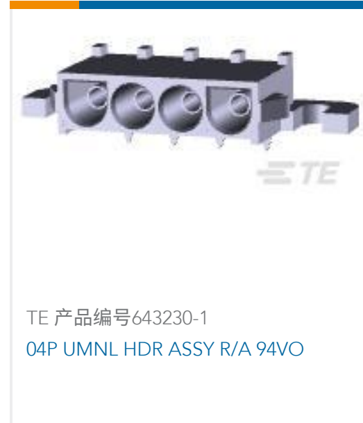
TE 产品编号643230-1 04P UMNL HDR ASSY R/A 94VO