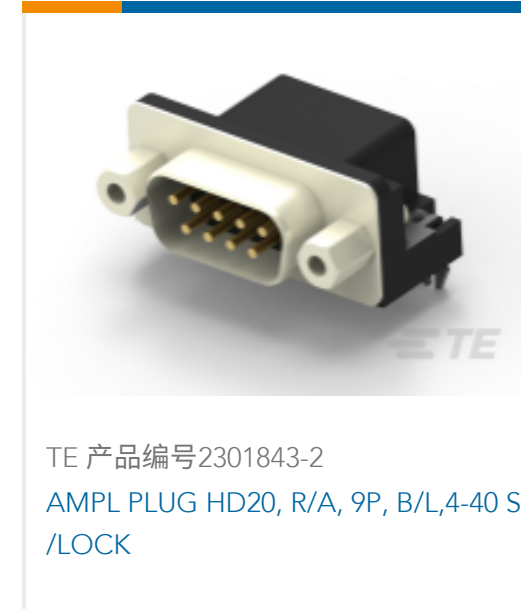
TE 产品编号2301843-2 AMPL PLUG HD20, R/A, 9P, B/L,4-40 S /LOCK