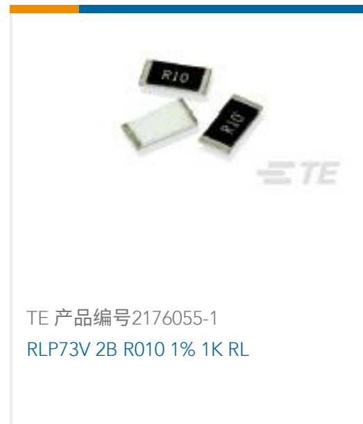
TE 产品编号2176055-1 RLP73V 2B R010 1% 1K RL