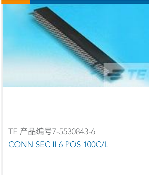
TE 产品编号7-5530843-6 CONN SEC II 6 POS 100C/L