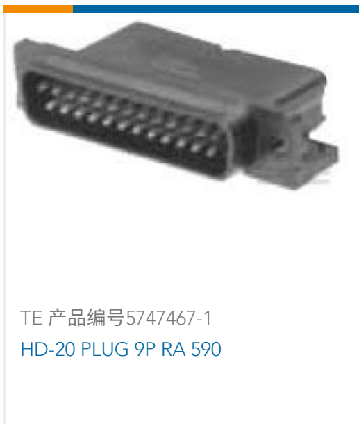
TE 产品编号5747467-1 HD-20 PLUG 9P RA 590