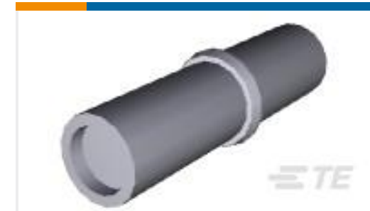
TE 产品编号1-480349-0 01P CMNL PLUG HSG F/H NATL