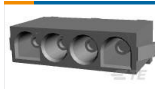
TE 产品编号350761-4 04P UMNL HDR ASSY PC