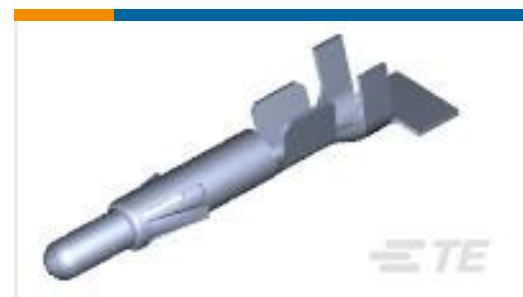
TE 产品编号350218-1 UMNL PIN 20-14 .0126PTPBR