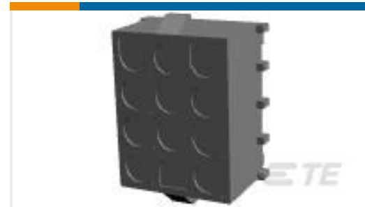
TE 产品编号350829-1 12P UMNL HDR ASSY PC 94VO