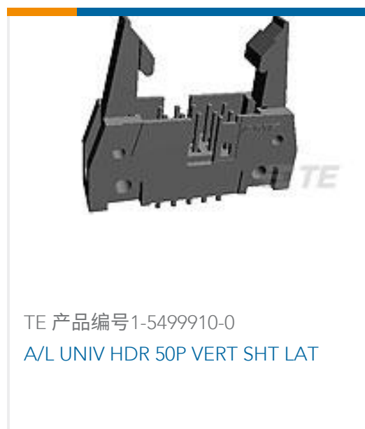
TE 产品编号1-5499910-0 A/L UNIV HDR 50P VERT SHT LAT