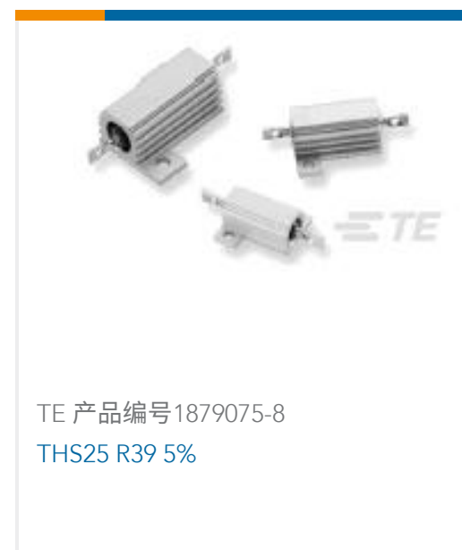
TE 产品编号1879075-8 THS25 R39 5%