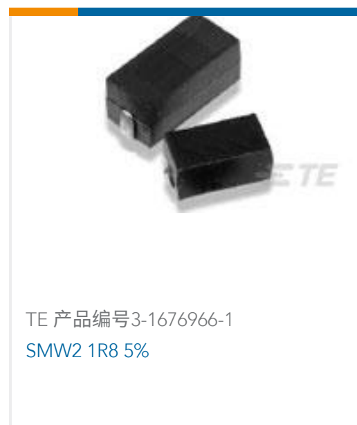
TE 产品编号3-1676966-1 SMW2 1R8 5%