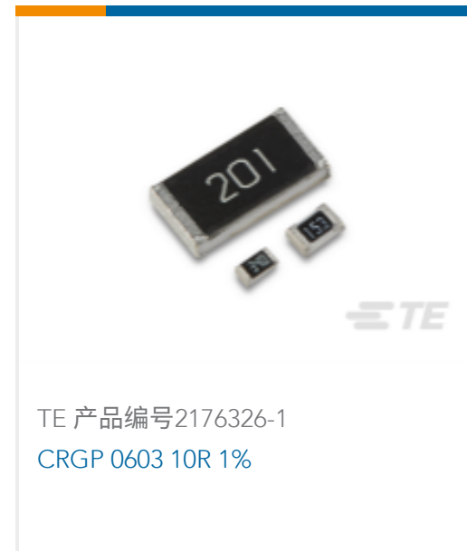
TE 产品编号2176326-1 CRGP 0603 10R 1%