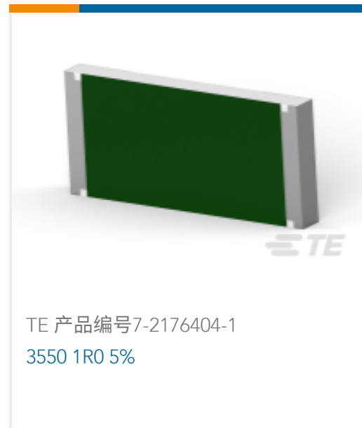
TE 产品编号7-2176404-1 3550 1R0 5%