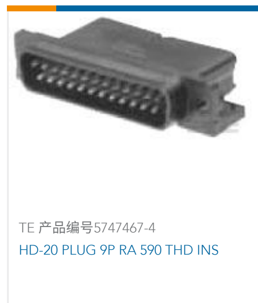
TE 产品编号5747467-4 HD-20 PLUG 9P RA 590 THD INS