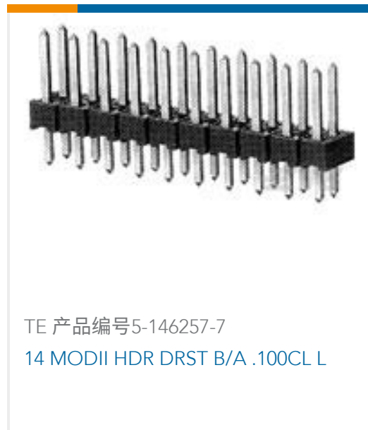
TE 产品编号5-146257-7 14 MODII HDR DRST B/A .100CL L