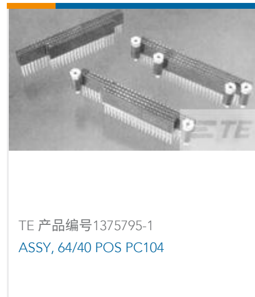
TE 产品编号1375795-1 ASSY, 64/40 POS PC104