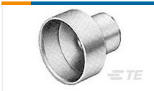
TE 产品编号3-747580-1 SHLDNG FERRULE, PLTD, BULK PKG