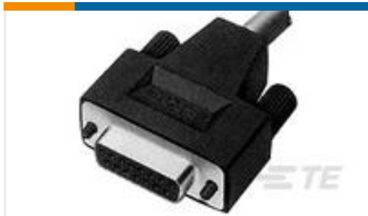
TE 产品编号1658660-1 KIT,HDP-20,ENCLSUR,RCPT,SIZE 4