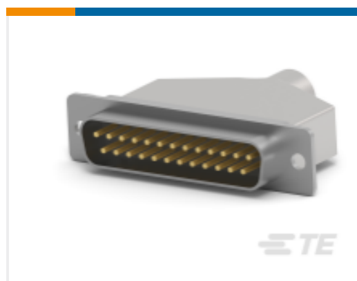
TE 产品编号 CAT-AM7-248H4 IDC D-Sub：连接器套件，插头，线对线，信号，2.77mm