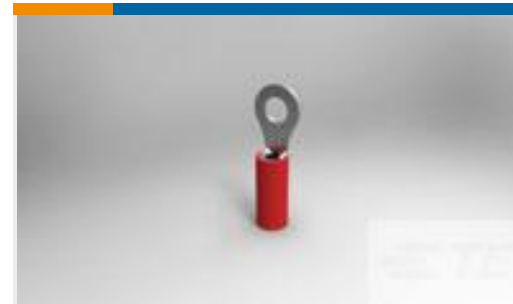
TE 产品编号7-51863-1 PIDG R 22-16 COMM 22-18 MIL 6