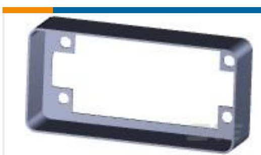
TE 产品编号201368-4 75 PL. EXTERNAL PIN HOOD