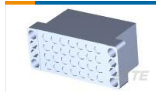
TE 产品编号205689-2 PIN BLOCK 28 POS. SPL.