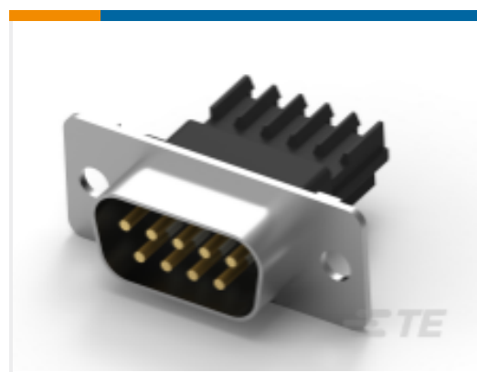
TE 产品编号 CAT-AM7-248H3 IDC D-Sub：插头组件，线对线，信号，2.77mm