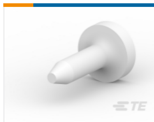
TE 产品编号 206509-1 SIZE 20 KEYING PLUG