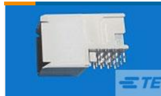
TE 产品编号120943-2 UPM R/A REC HC 4P Power Connector