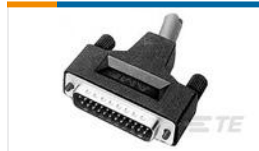
TE 产品编号1-747950-5 KIT,PLUG,37P,HDE,SHLD ENCLSRE