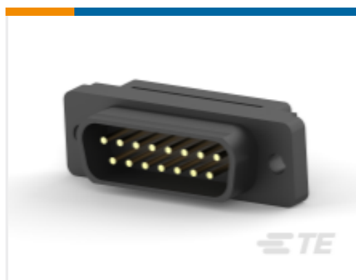
TE 产品编号 CAT-AM7-H3 IDC D-Sub：插头组件，小尺寸，信号，2.77mm