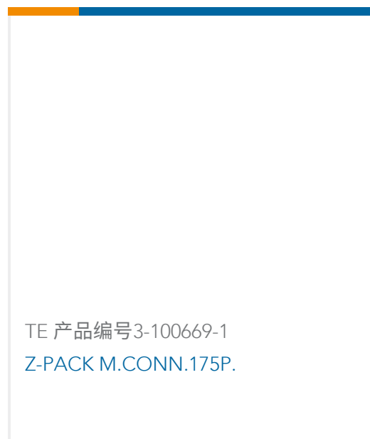
TE 产品编号3-100669-1 Z-PACK M.CONN.175P.