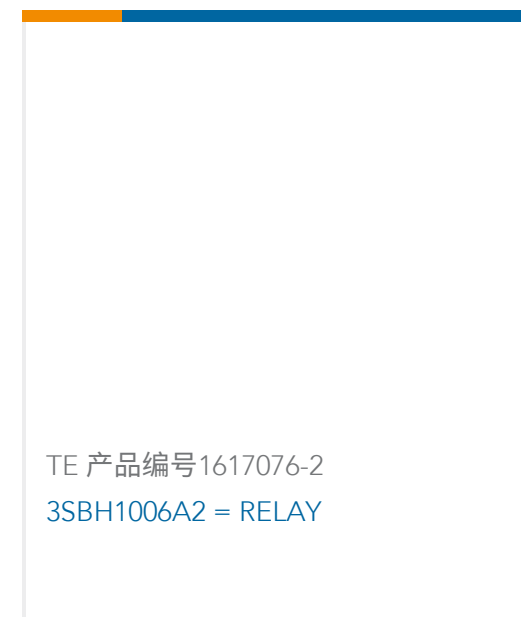
TE 产品编号1617076-2 3SBH1006A2 = RELAY