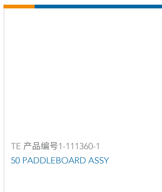
TE 产品编号1-111360-1 50 PADDLEBOARD ASSY