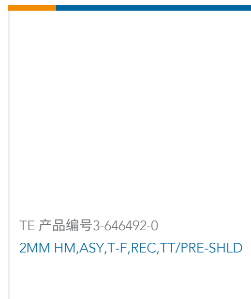
TE 产品编号3-646492-0 2MM HM,ASY,T-F,REC,TT/PRE-SHLD