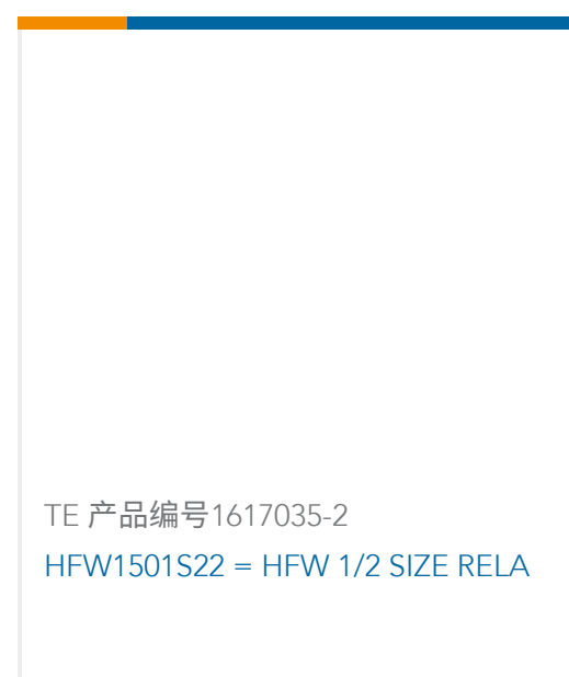
TE 产品编号1617035-2 HFW1501S22 = HFW 1/2 SIZE RELA