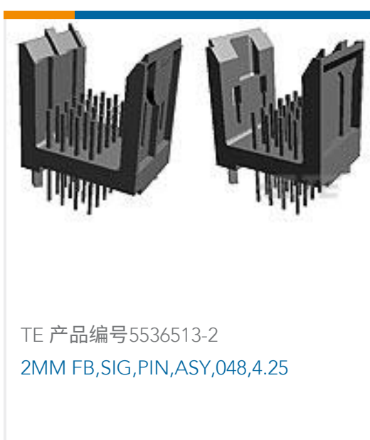
TE 产品编号5536513-2 2MM FB,SIG,PIN,ASY,048,4.25