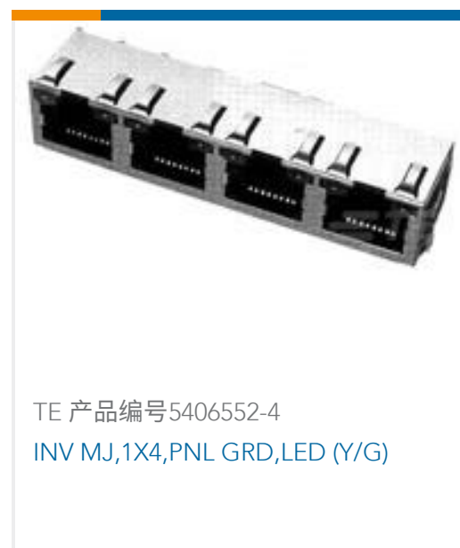
TE 产品编号5406552-4 INV MJ,1X4,PNL GRD,LED (Y/G)