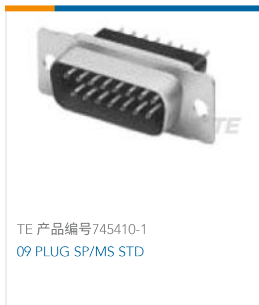
TE 产品编号745410-1 09 PLUG SP/MS STD