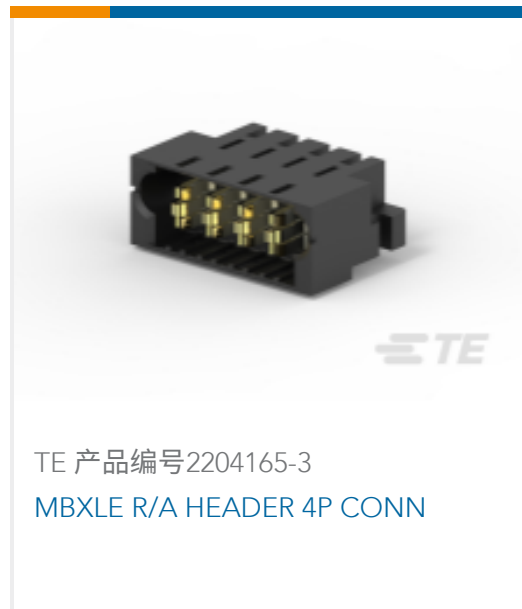
TE 产品编号2204165-3 MBXLE R/A HEADER 4P CONN