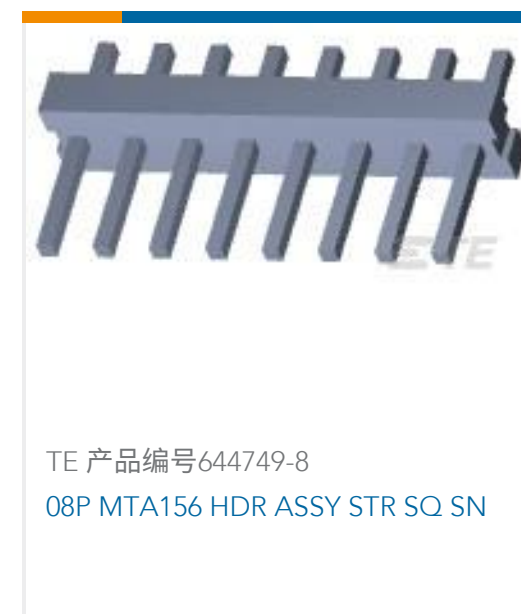
TE 产品编号644749-8 08P MTA156 HDR ASSY STR SQ SN