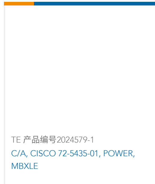
TE 产品编号2024579-1 C/A, CISCO 72-5435-01, POWER, MBXLE