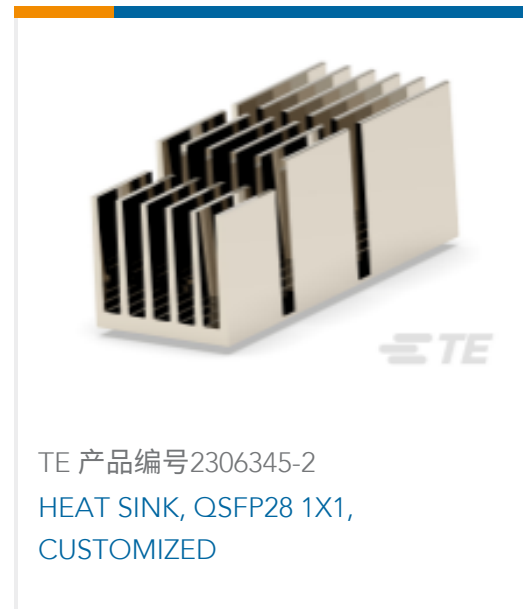
TE 产品编号2306345-2 HEAT SINK, QSFP28 1X1, CUSTOMIZED