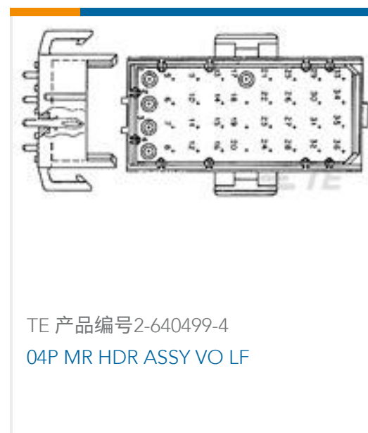
TE 产品编号2-640499-4 04P MR HDR ASSY VO LF