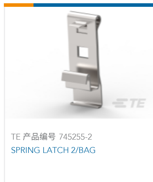
TE 产品编号 745255-2 SPRING LATCH 2/BAG