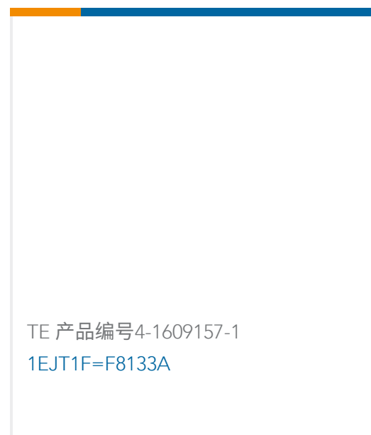
TE 产品编号4-1609157-1 1EJT1F=F8133A