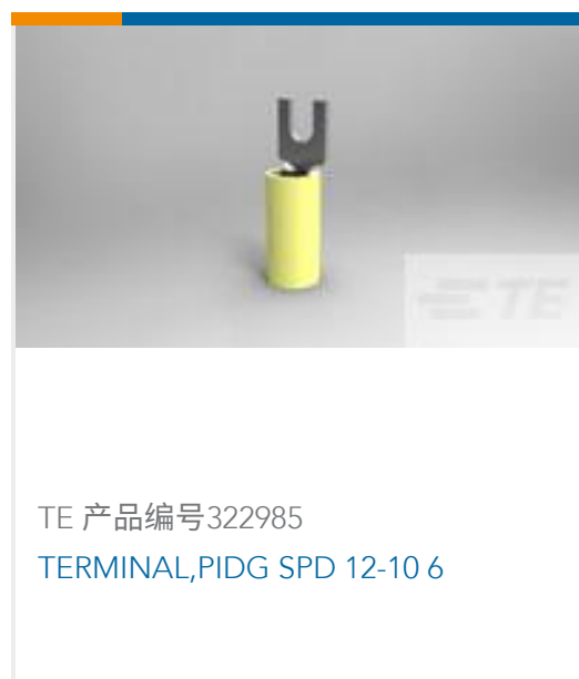
TE 产品编号322985 TERMINAL,PIDG SPD 12-10 6