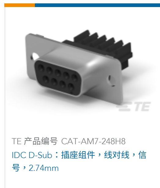
TE 产品编号 CAT-AM7-248H8 IDC D-Sub：插座组件，线对线，信号，2.74mm