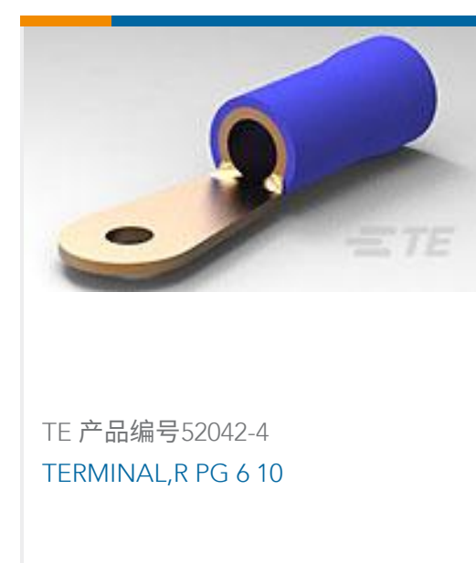
TE 产品编号52042-4 TERMINAL,R PG 6 10