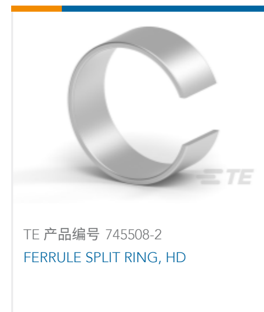
TE 产品编号 745508-2 FERRULE SPLIT RING, HD