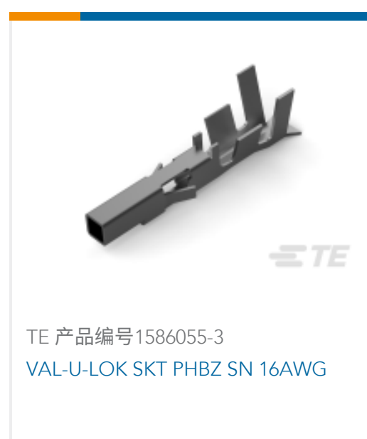
TE 产品编号1586055-3 VAL-U-LOK SKT PHBZ SN 16AWG