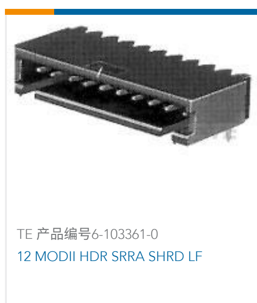
TE 产品编号6-103361-0 12 MODII HDR SRRA SHRD LF