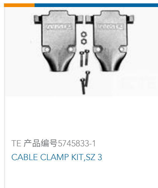
TE 产品编号5745833-1 CABLE CLAMP KIT,SZ 3