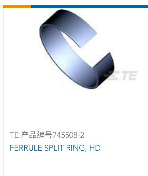
TE 产品编号745508-2 FERRULE SPLIT RING, HD