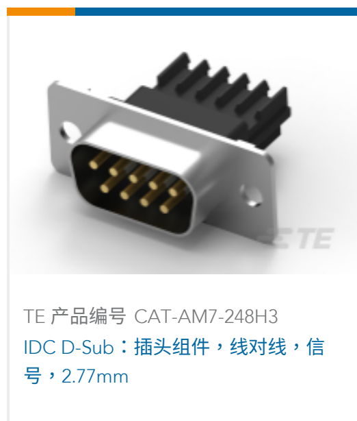
TE 产品编号 CAT-AM7-248H3 IDC D-Sub：插头组件，线对线，信号，2.77mm