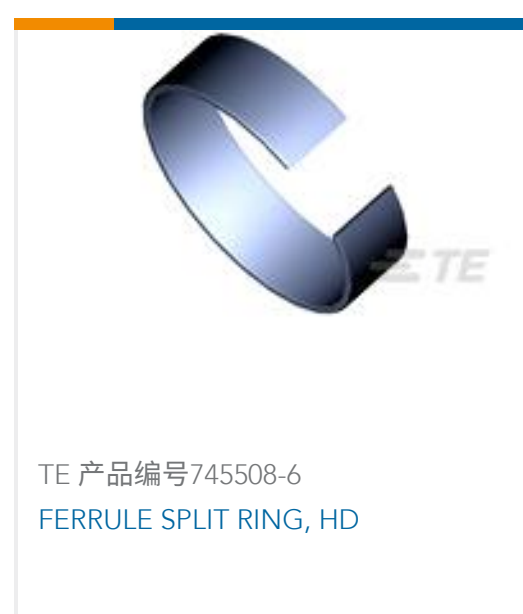
TE 产品编号745508-6 FERRULE SPLIT RING, HD