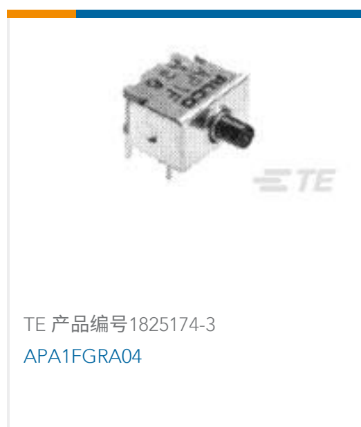
TE 产品编号1825174-3 APA1FGRA04