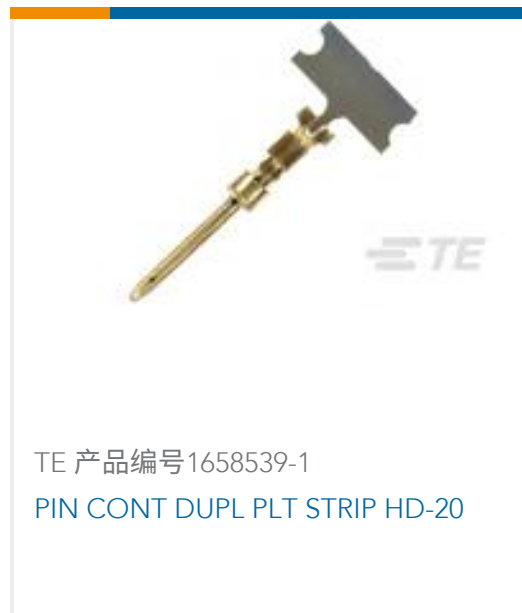
TE 产品编号1658539-1 PIN CONT DUPL PLT STRIP HD-20