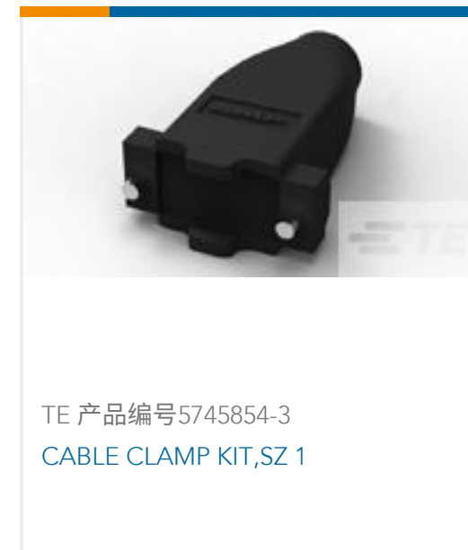
TE 产品编号5745854-3 CABLE CLAMP KIT, SZ 1