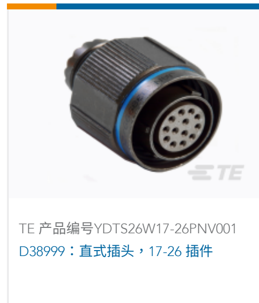
TE 产品编号YDTS26W17-26PNV001 D38999: 直式插头, 17-26 插件