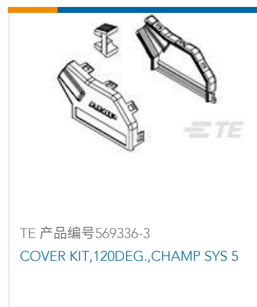
TE 产品编号569336-3 COVER KIT, 120DEG., CHAMP SYS 5