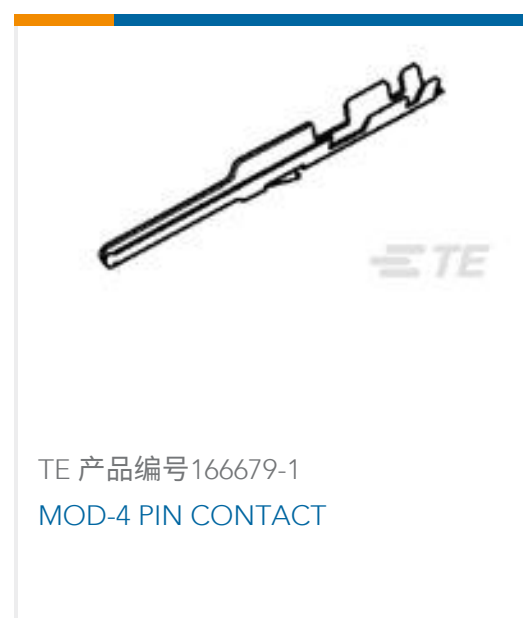
TE 产品编号166679-1 MOD-4 PIN CONTACT