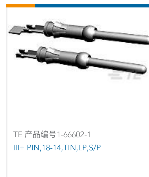
TE 产品编号1-66602-1 III+ PIN, 18-14, TIN, LP, S/P