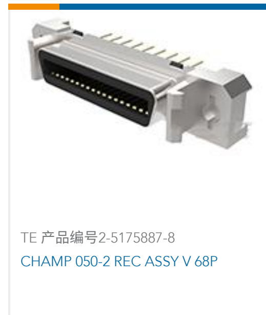
TE 产品编号2-5175887-8 CHAMP 050-2 REC ASSY V 68P