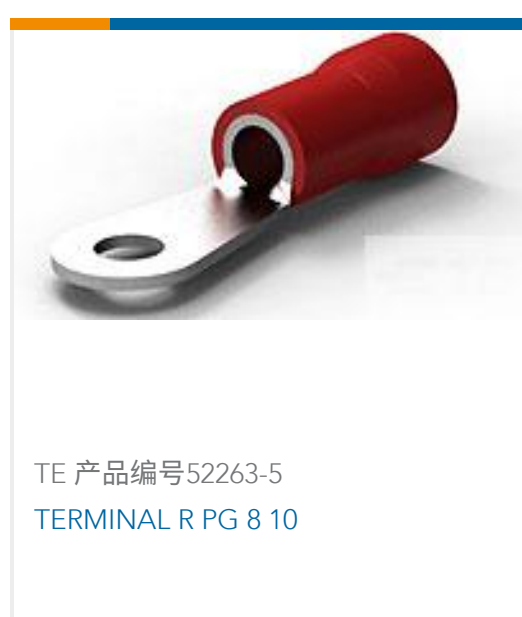
TE 产品编号52263-5 TERMINAL R PG 8 10