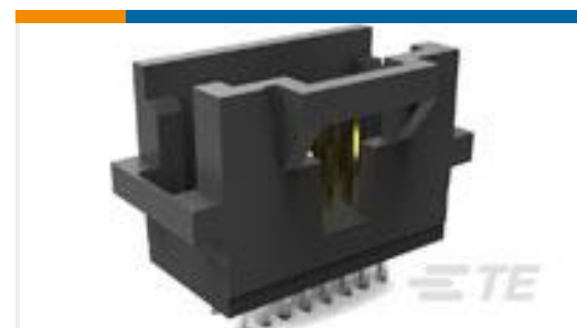
TE 产品编号6-104068-7 100 SYSTEM 50 HDR DRST SHRD