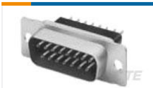
TE 产品编号5745414-1 50 PLUG SP/MS STD