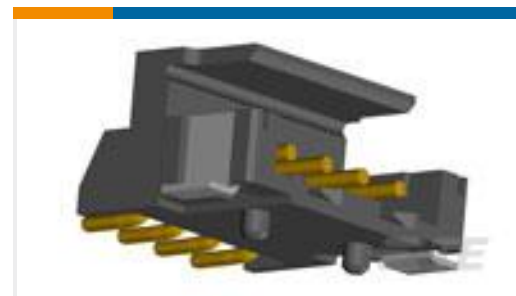
TE 产品编号292173-8 CT BOX HDR H SMT 8P O/TAPE BLA