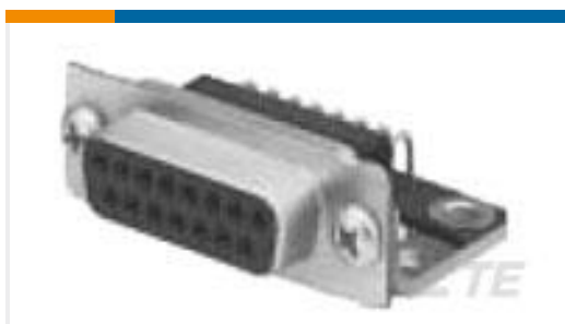
TE 产品编号5747020-1 09 RCPT RA/MS STD (SL)