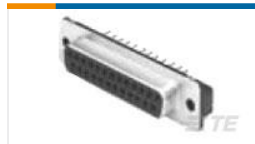
TE 产品编号5747150-7 09 RCPT SP/FMS INSRT