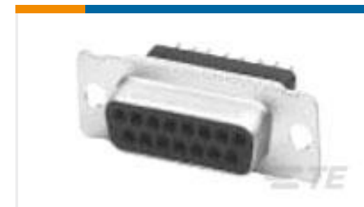
TE 产品编号5745189-1 37 RCPT SP/MS STD