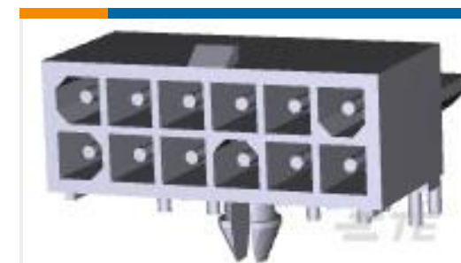
TE 产品编号1-770972-1 12P MINI UMNL R/A HDR ASSY LF