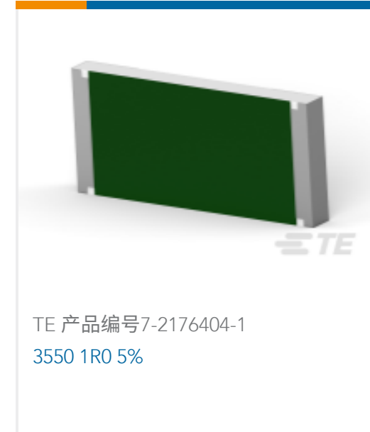
TE 产品编号7-2176404-1 3550 1R0 5%