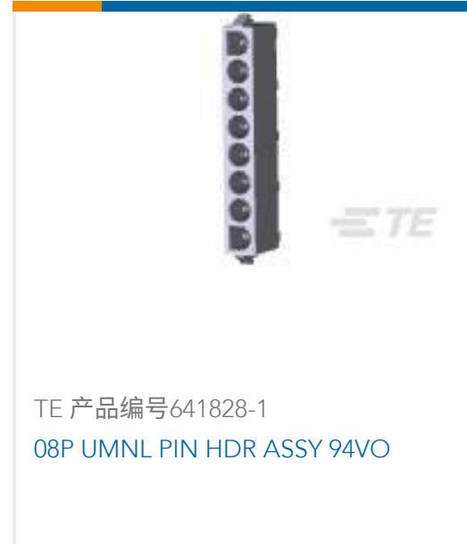
TE 产品编号641828-1 08P UMNL PIN HDR ASSY 94VO