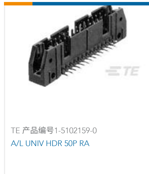
TE 产品编号1-5102159-0 A/L UNIV HDR 50P RA