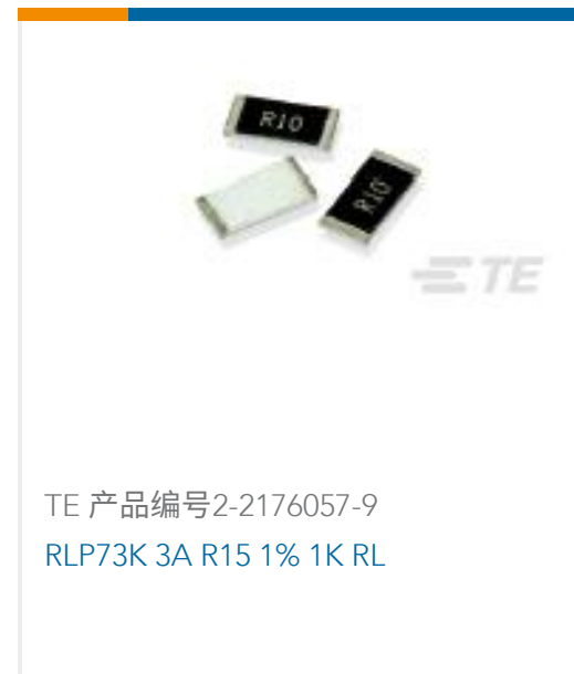
TE 产品编号2-2176057-9 RLP73K 3A R15 1% 1K RL