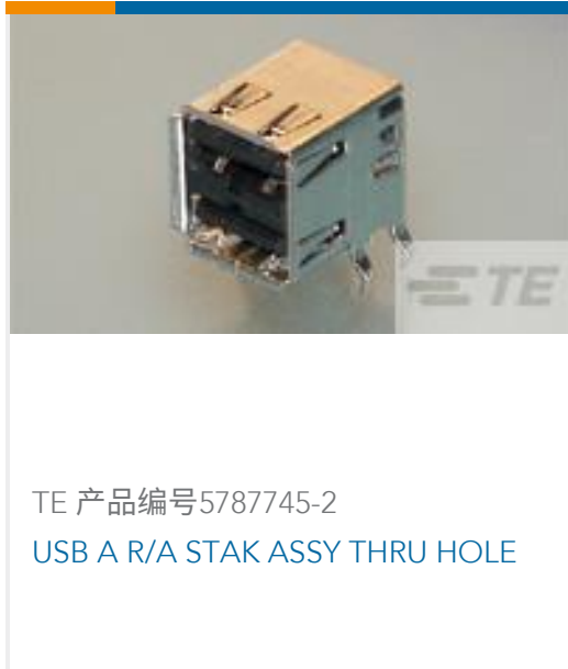
TE 产品编号5787745-2 USB A R/A STAK ASSY THRU HOLE