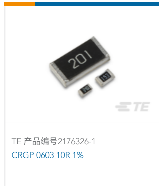
TE 产品编号2176326-1 CRGP 0603 10R 1%