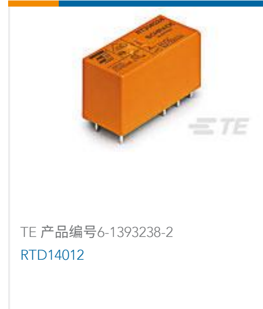
TE 产品编号6-1393238-2 RTD14012