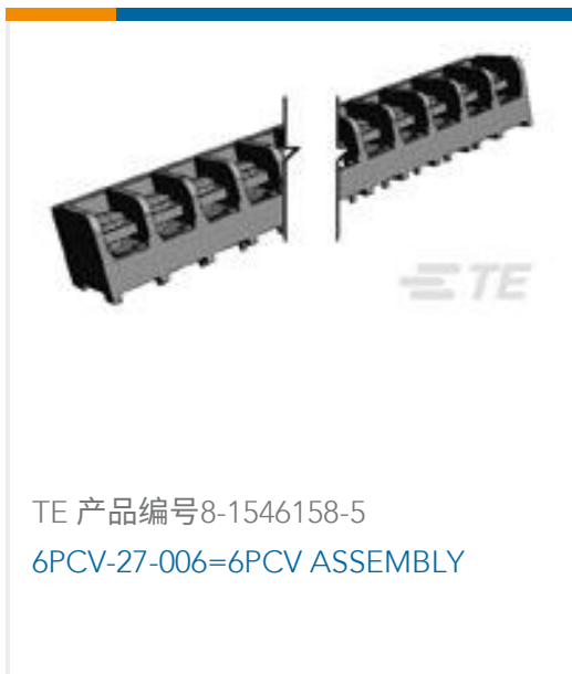
TE 产品编号8-1546158-5 6PCV-27-006=6PCV ASSEMBLY