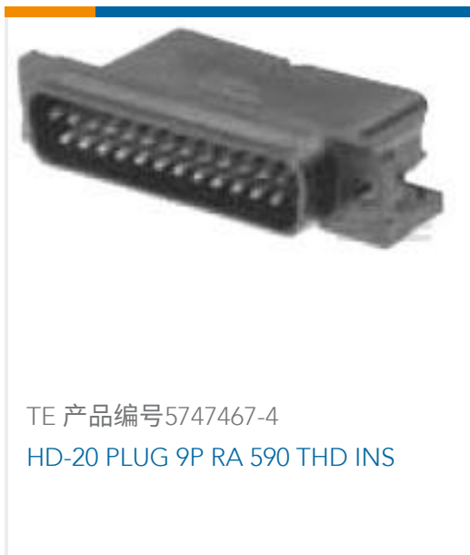
TE 产品编号5747467-4 HD-20 PLUG 9P RA 590 THD INS