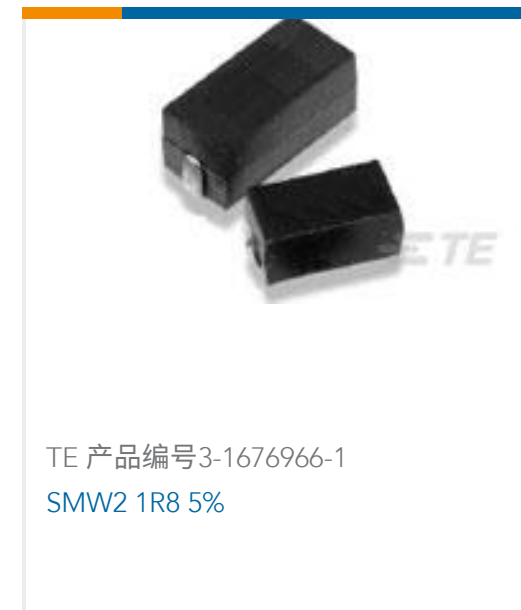
TE 产品编号3-1676966-1 SMW2 1R8 5%