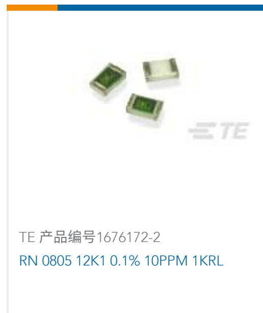
TE 产品编号1676172-2 RN 0805 12K1 0.1% 10PPM 1KRL