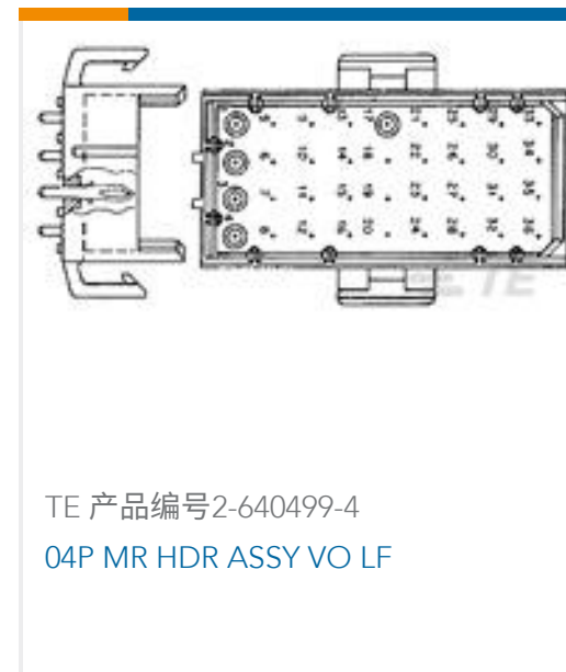
TE 产品编号2-640499-4 04P MR HDR ASSY VO LF