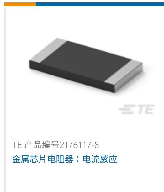
TE 产品编号2176117-8 金属芯片电阻器：电流感应