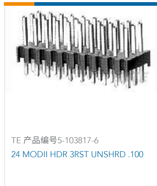
TE 产品编号5-103817-6 24 MODII HDR 3RST UNSHRD .100