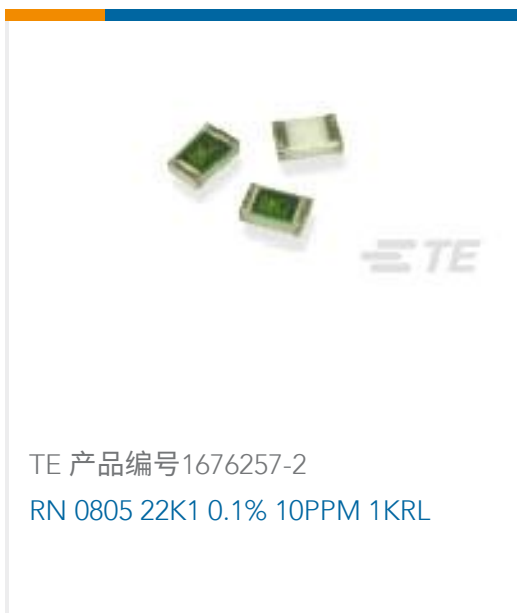
TE 产品编号1676257-2 RN 0805 22K1 0.1% 10PPM 1KRL