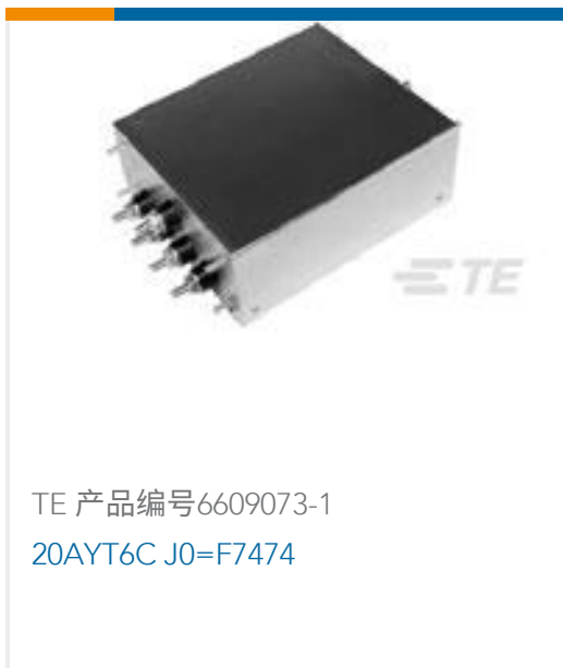
TE 产品编号6609073-1 20AYT6C J0=F7474