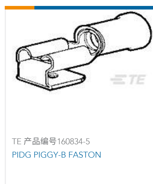
TE 产品编号 160834-5 PIDG PIGGY-B FASTON