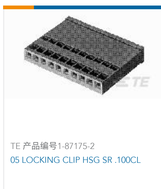
TE 产品编号 1-87175-2 05 LOCKING CLIP HSG SR .100CL