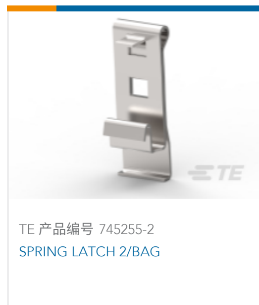
TE 产品编号 745255-2 SPRING LATCH 2/BAG