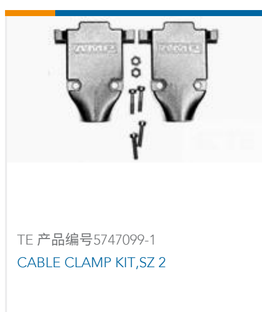
TE 产品编号 5747099-1 CABLE CLAMP KIT, SZ 2