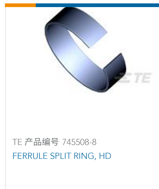
TE 产品编号 745508-8 FERRULE SPLIT RING, HD