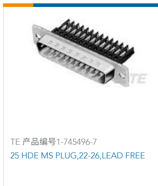
TE 产品编号 1-745496-7 25 HDE MS PLUG, 22-26, LEAD FREE