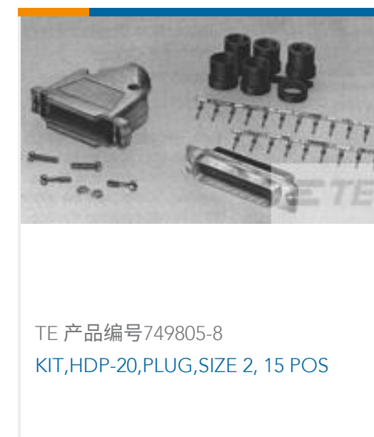
TE 产品编号 749805-8 KIT, HDP-20, PLUG, SIZE 2, 15 POS