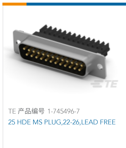
TE 产品编号 1-745496-7 25 HDE MS PLUG, 22-26, LEAD FREE