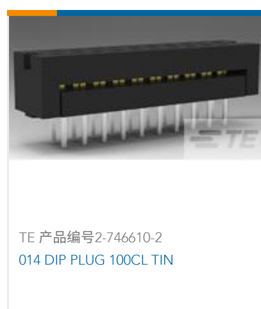
TE 产品编号 2-746610-2 014 DIP PLUG 100CL TIN