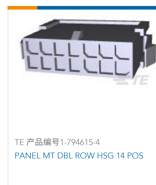
TE 产品编号 1-794615-4 PANEL MT DBL ROW HSG 14 POS