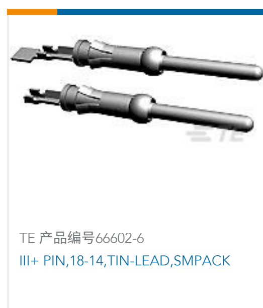
TE 产品编号 66602-6 III+ PIN, 18-14, TIN-LEAD, SMPACK