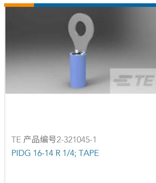
TE 产品编号 2-321045-1 PIDG 16-14 R 1/4; TAPE