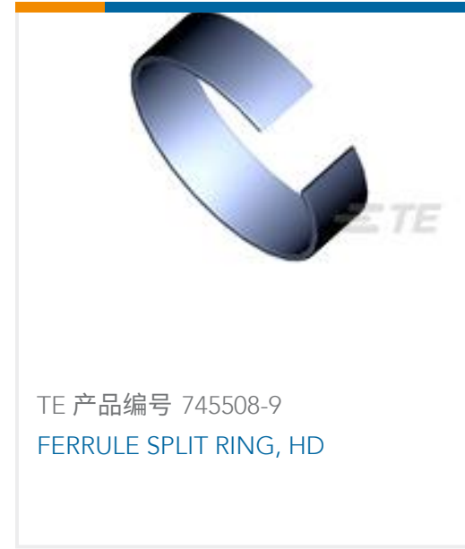
TE 产品编号 745508-9 FERRULE SPLIT RING, HD