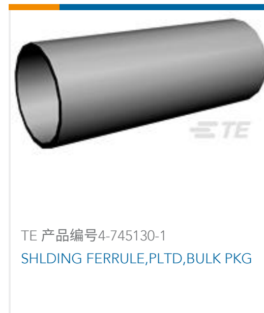
TE 产品编号4-745130-1 SHLDING FERRULE,PLTD,BULK PKG