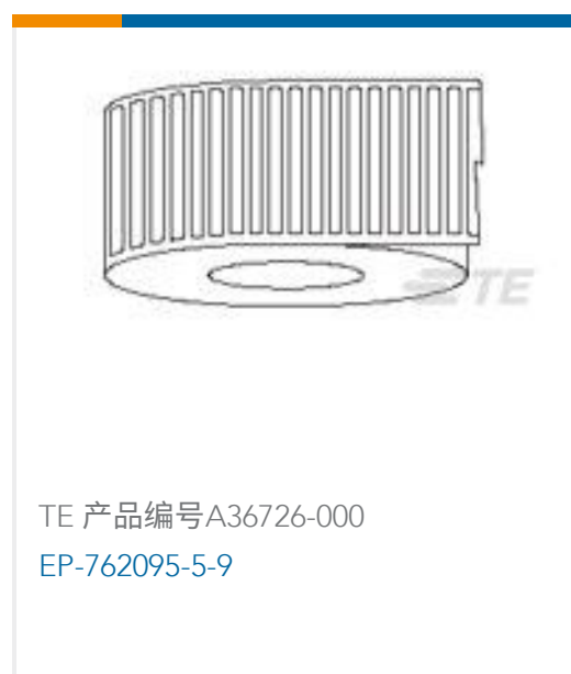
TE 产品编号A36726-000 EP-762095-5-9