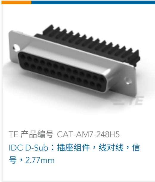
TE 产品编号 CAT-AM7-248H5 IDC D-Sub：插座组件，线对线，信号，2.77mm