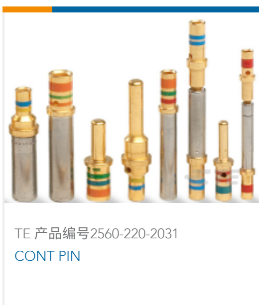
TE 产品编号2560-220-2031 CONT PIN