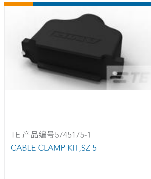
TE 产品编号5745175-1 CABLE CLAMP KIT,SZ 5