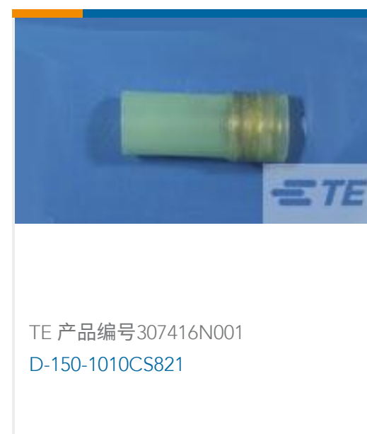
TE 产品编号307416N001 D-150-1010CS821