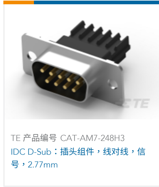
TE 产品编号 CAT-AM7-248H3 IDC D-Sub：插头组件，线对线，信号，2.77mm