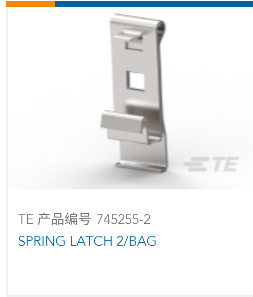
TE 产品编号 745255-2 SPRING LATCH 2/BAG