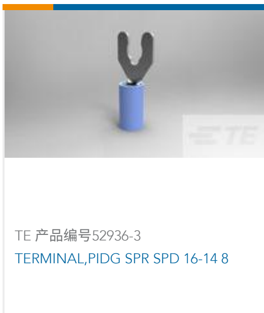
TE 产品编号52936-3 TERMINAL,PIDG SPR SPD 16-14 8