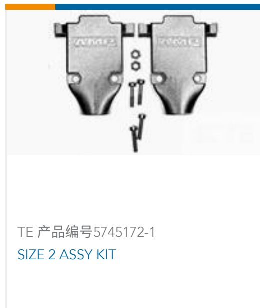
TE 产品编号5745172-1 SIZE 2 ASSY KIT