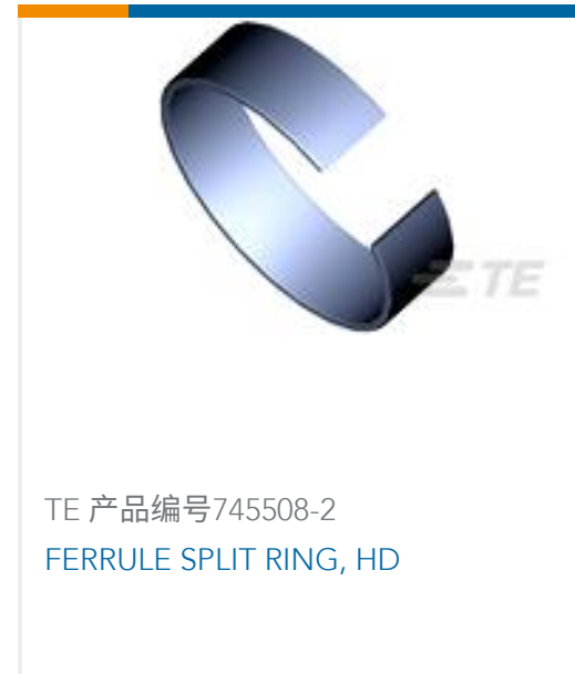
TE 产品编号745508-2 FERRULE SPLIT RING, HD