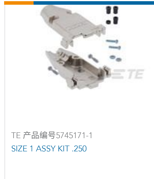
TE 产品编号5745171-1 SIZE 1 ASSY KIT .250