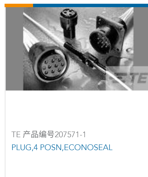
TE 产品编号207571-1 PLUG,4 POSN,ECONOSEAL