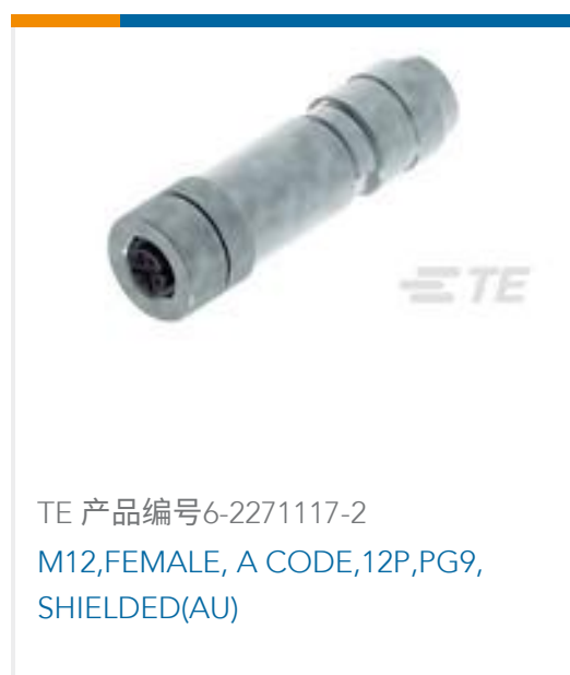
TE 产品编号6-2271117-2 M12,FEMALE, A CODE,12P,PG9, SHIELDED(AU)