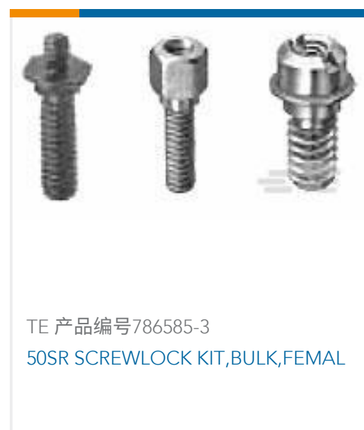
TE 产品编号786585-3 50SR SCREWLOCK KIT,BULK,FEMAL