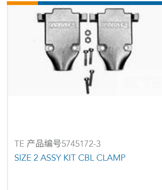
TE 产品编号5745172-3 SIZE 2 ASSY KIT CBL CLAMP