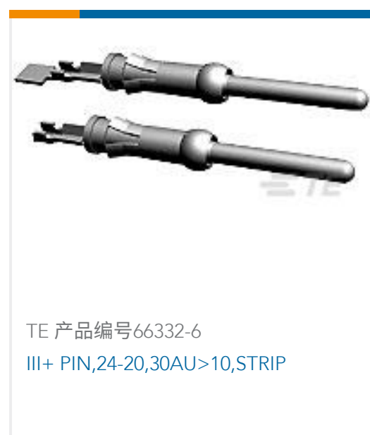
TE 产品编号66332-6 III+ PIN,24-20,30AU>10,STRIP