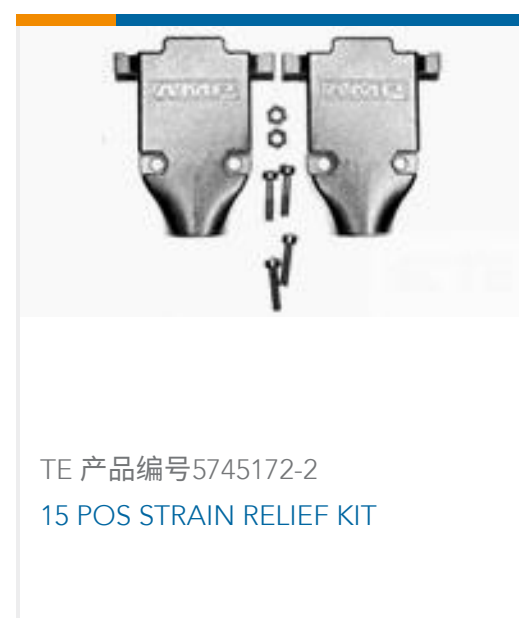
TE 产品编号5745172-2 15 POS STRAIN RELIEF KIT