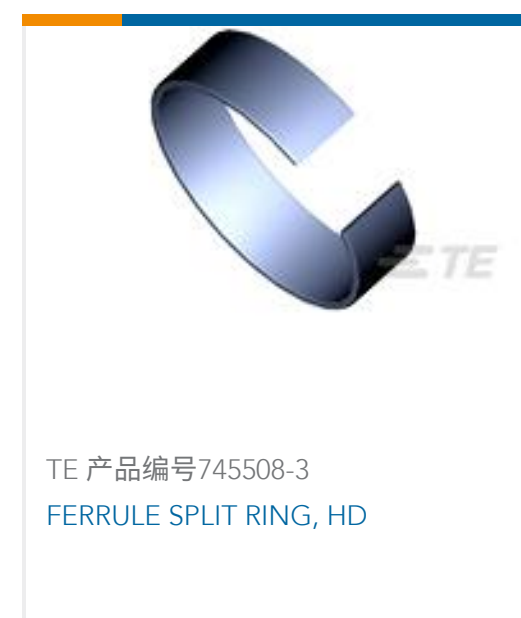
TE 产品编号745508-3 FERRULE SPLIT RING, HD