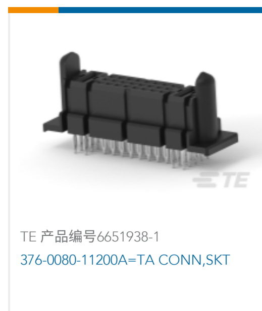
TE 产品编号6651938-1 376-0080-11200A=TA CONN,SKT