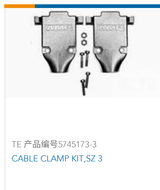
TE 产品编号5745173-3 CABLE CLAMP KIT,SZ 3