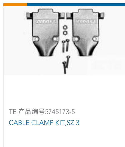
TE 产品编号5745173-5 CABLE CLAMP KIT,SZ 3