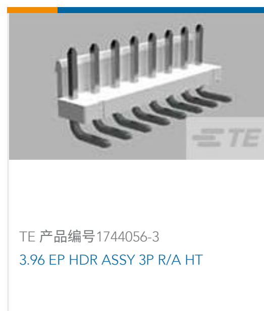
TE 产品编号1744056-3 3.96 EP HDR ASSY 3P R/A HT