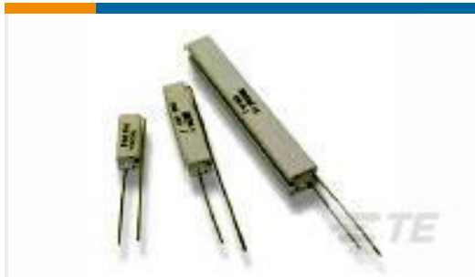
TE 产品编号1-1623730-5 BCHE 4 W 33R 5%