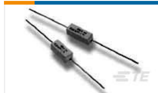
TE 产品编号1-1623819-4 SBL4 R051 5%