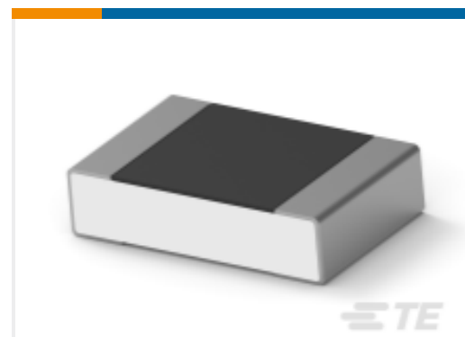
TE 产品编号1-2176378-0 RQ 0805 12R4 0.1% 10PPM 5K RL