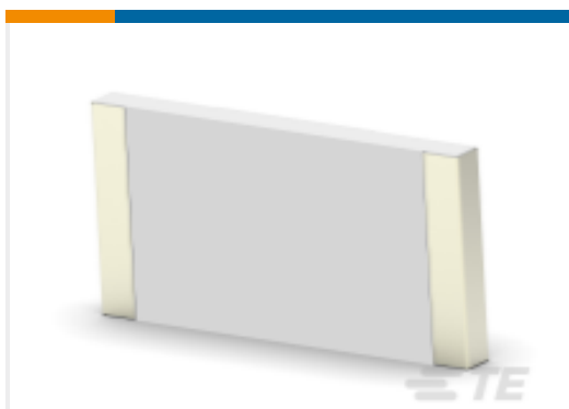
TE 产品编号3-2176246-8 CRGS2512 5% 1K2