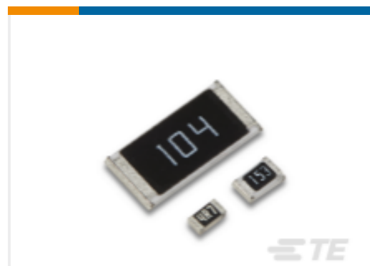
TE 产品编号5-2176341-8 CRGCQ 0805 560K 1%