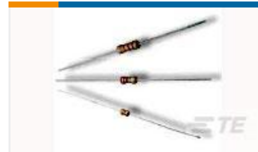
TE 产品编号7-1623931-9 CFR25 5% 82R