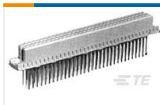
TE 产品编号1-148059-5 096 EURO TYP C RECP 17MM ASSY