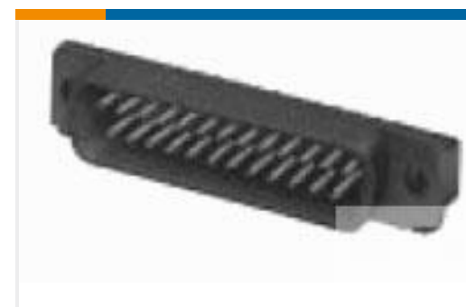
TE 产品编号745072-4 15 PLUG SP/AP SCRLK