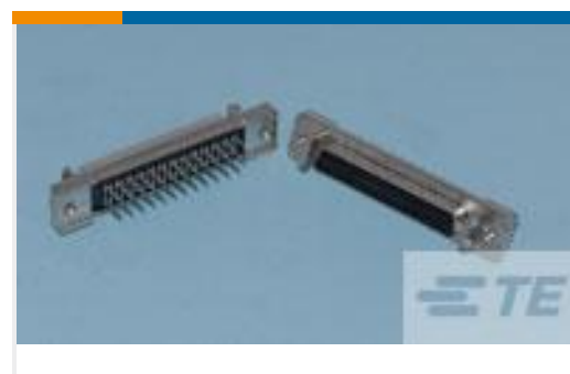
TE 产品编号5786555-7 68 50SR VRT RCPT,FL TOP,ACT PN