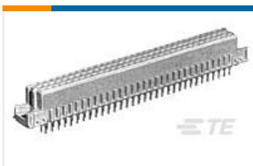
TE 产品编号535059-4 064 EURO TYPE C RECEPT AP ASSY