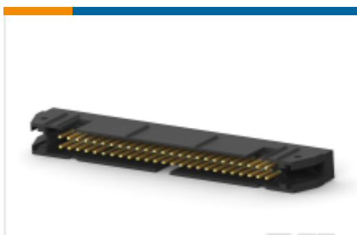
TE 产品编号5102156-6 AMP 锁门通用插头