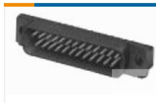
TE 产品编号5745074-4 HD-20 PLUG 37P VERT FFSCRLK