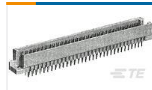
TE 产品编号5650470-5 ASSY,PIN,EUROCARD,TYPE R,LEAD-