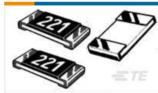
TE 产品编号3-2176230-4 3522 470R 5% 3W