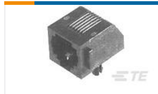
TE 产品编号5555165-1 M/J, LPF, R/A, 6P/6C, TIN, BUL