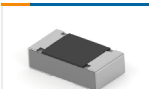
TE 产品编号1-2176481-1 RA73F 1J 7K5 0.1% 5K RL