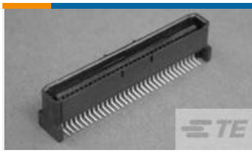
TE 产品编号5120527-2 1FHP,84,30A/S,S,N,S10,12,13,15