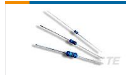
TE 产品编号1622302-1 LR1 1% 10R