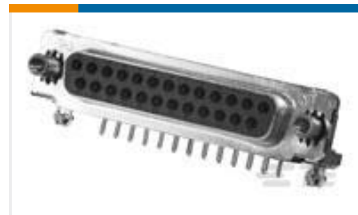
TE 产品编号747844-5 09 MSFL RCPT RA 318 (SL,FM,BL)