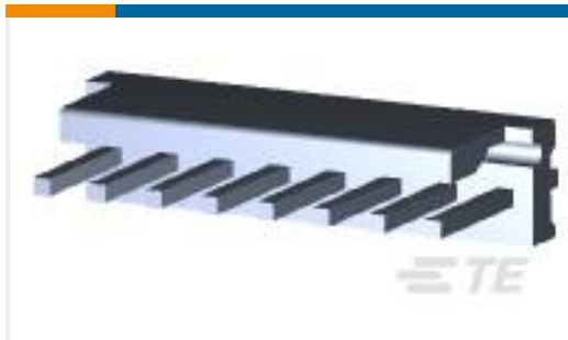
TE 产品编号3-640445-8 08P MTA156 HDR ASSY FL/STR SN