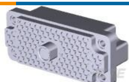
TE 产品编号201532-4 RECEPT BLOCK, 104 POSN, M SERIES