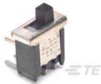
TE 产品编号1571982-1 TSS11DGPC04=SLIDE SWITCH SPDT