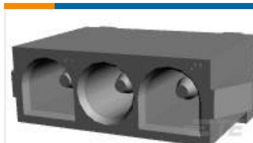
TE 产品编号350429-4 03P UMNL PIN HDR ASSY NATL LF