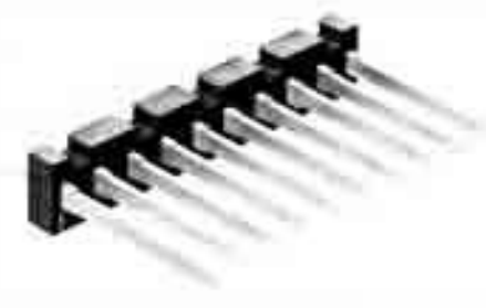
TE 产品编号87113-4 04 MODI HDR SRST .156CL