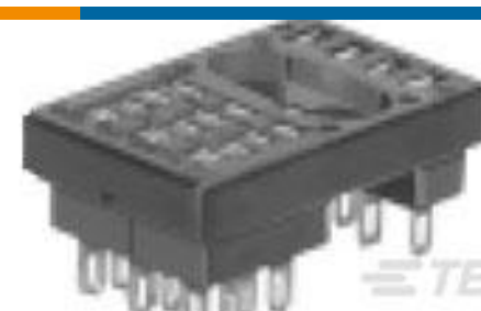
TE 产品编号1-1393143-2 27E129=SOCKET, R10, 16, PC, PHEN