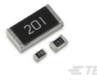
TE 产品编号2176330-2 CRGP 2010 12R 1%