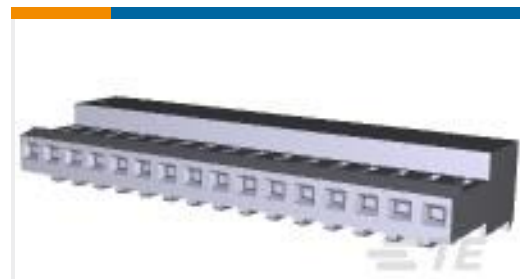
TE 产品编号4-640441-6 16P MTA100 CONN ASSY WHT