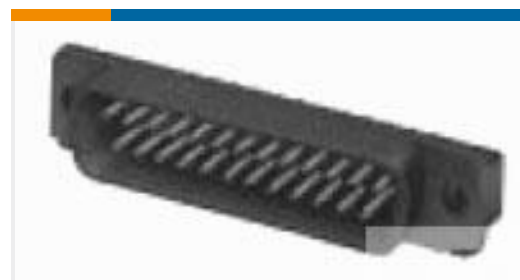
TE 产品编号5745072-2 HD-20 PLUG 15P VERT FFSCRLK