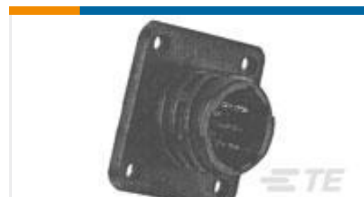
TE 产品编号205841-1 CPC RECPT ASSEMBLY SIZE 11-8