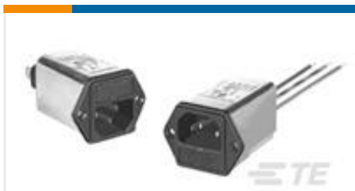
TE 产品编号2-6609115-3 6EGG1-2=F7386D