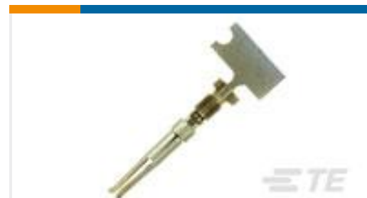
TE 产品编号66504-9 SOCKET CONTACT, 20 DF