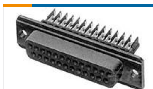
TE 产品编号 745209-8 RCPT ASSY,25P,HDE,AP