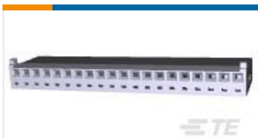
TE 产品编号2-1375820-0 CST-100 II HOUSING 20 POS