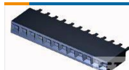
TE 产品编号6-535541-0 12 MODIV VRT SR CE 100/115