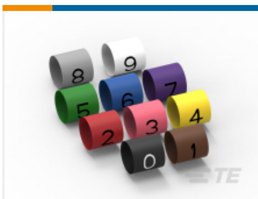
TE 产品编号5059070009 TRSA 热缩管