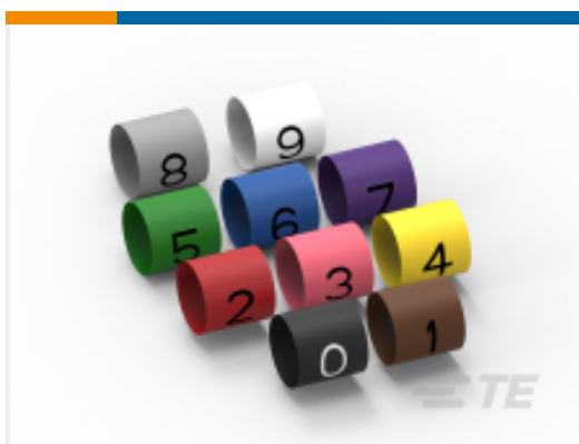
TE 产品编号5059070009 TRSA 热缩管