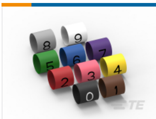
TE 产品编号5059070007 TRSA-1014/C/1/3