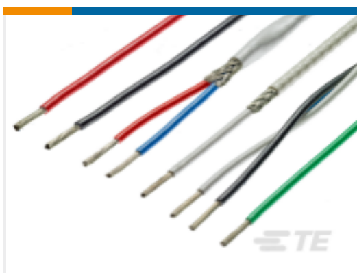
TE 产品编号4651683001 100G0111-0.60-8