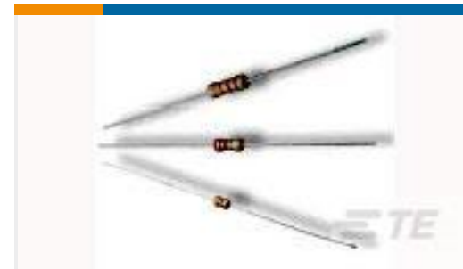
TE 产品编号1623932-8 CFR50 5% 10K