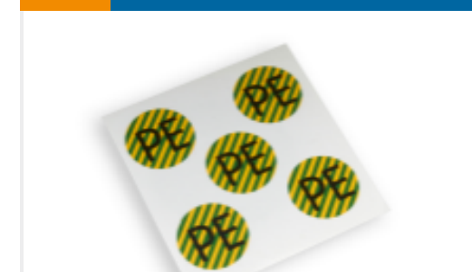
TE 产品编号469096-000 LKZ Vinyl Electric Symbol Labels