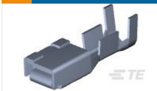
TE 产品编号316041-6 DYNAMIC D-5 REC CONT M L/P