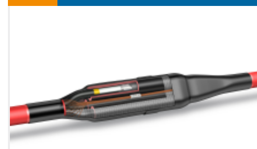
TE 产品编号CA6986-011 MXSU-3321