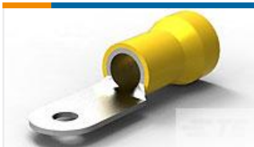
TE 产品编号52043-2 TERMINAL R PG 4 10