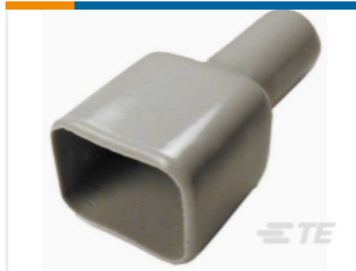
TE 产品编号DT8P-BT BOOT, 8P, REC, ST, GRY