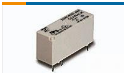
TE 产品编号4-1416200-8 V23061B1004A301