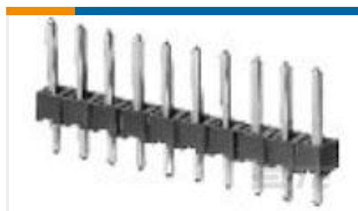
TE 产品编号6-146276-1 11 MODII HDR SRST B/A .100CL