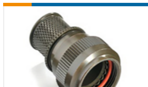
TE 产品编号BTF1-16-14-1-B-SB BTF1-16-14-1-B-SB