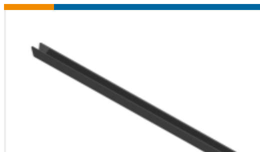
TE 产品编号5068832008 TPEM-NR9-0-STK