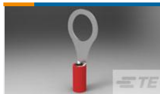
TE 产品编号8-328975-1 PIDG R 22-16 COMM 22-18MIL 1/2