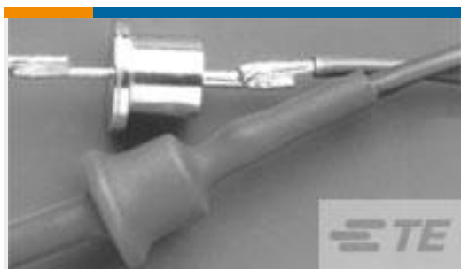
TE 产品编号5677932007 RNF-3000-9/3-X-STK