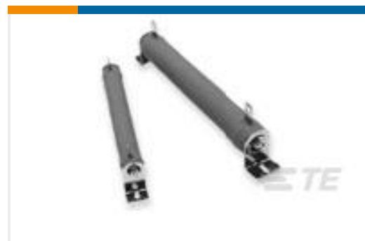
TE 产品编号1879449-7 TE 400W 3R3 5% Bracket