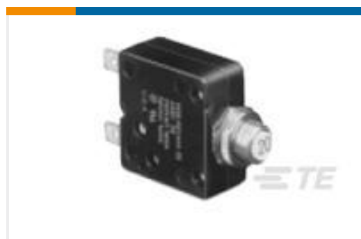
TE 产品编号4-1393249-4 W58-XC4C12A-25=W58