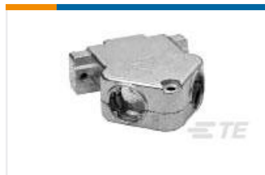
TE 产品编号1534811-1 HD20 COVER KIT37POS WITH CABLE CLAMPS