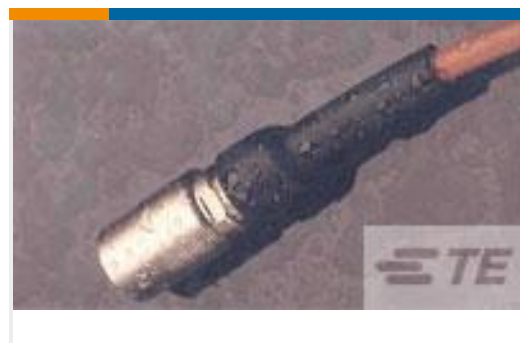
TE 产品编号3421332006 CGAT-6/2-0-STK