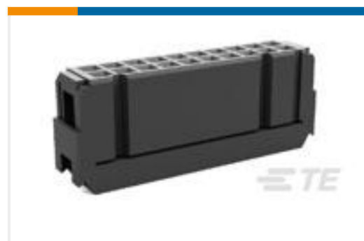
TE 产品编号1658620-5 24 NOVO MIL 15DP, LEAD FREE