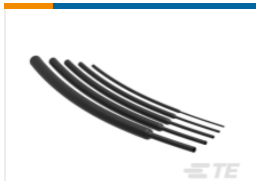
TE 产品编号5053042067 RNF-100-0 热缩管