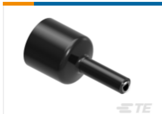
TE 产品编号NB08074001 HTAT-48/13-0-SP