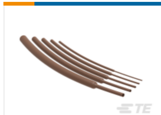
TE 产品编号5053194052 RNF-100-1 热缩管