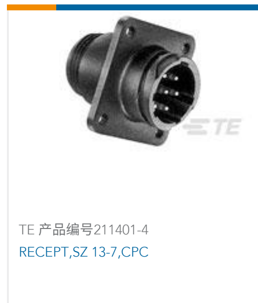
TE 产品编号211401-4 RECEPT,SZ 13-7,CPC