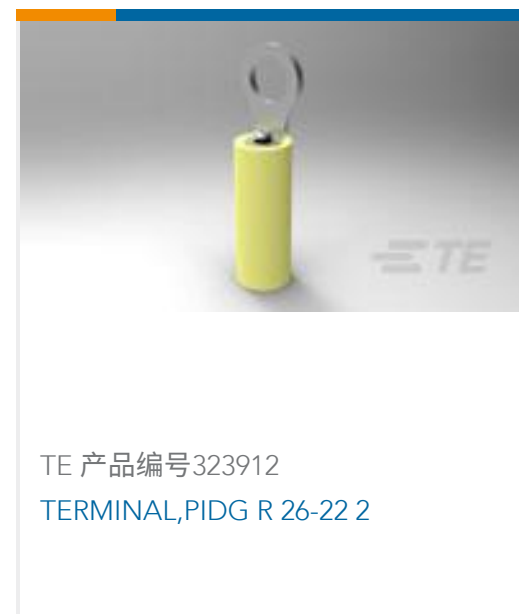
TE 产品编号323912 TERMINAL,PIDG R 26-22 2