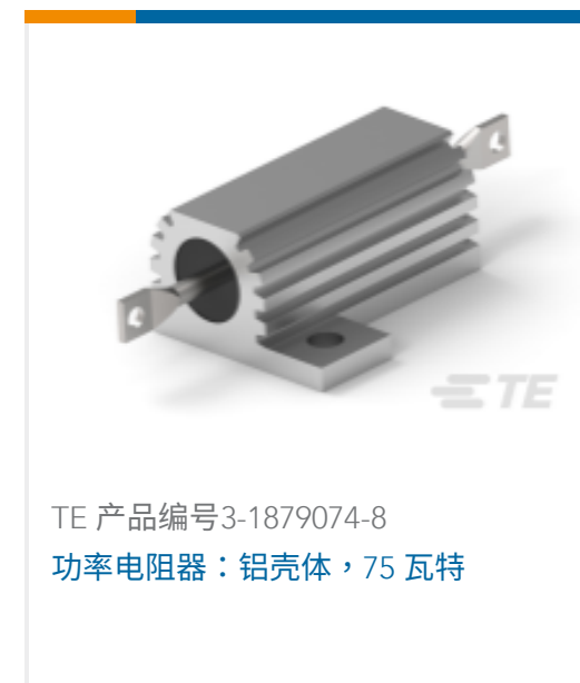
TE 产品编号3-1879074-8 功率电阻器：铝壳体，75 瓦特