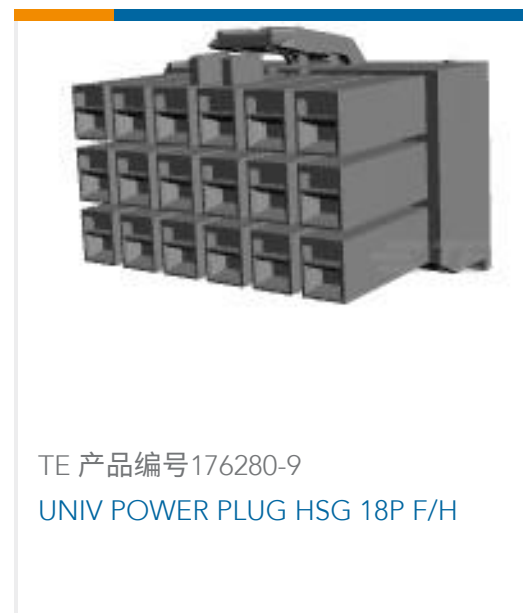
TE 产品编号176280-9 UNIV POWER PLUG HSG 18P F/H