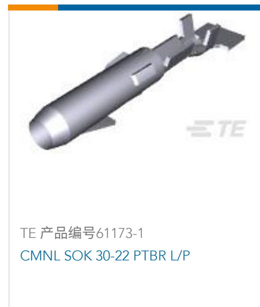
TE 产品编号61173-1 CMNL SOK 30-22 PTBR L/P