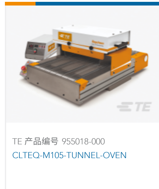
TE 产品编号 955018-000 CLTEQ-M105-TUNNEL-OVEN