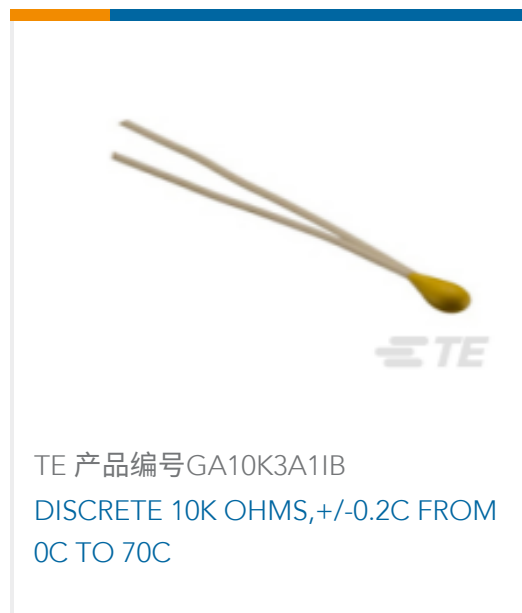
TE 产品编号GA10K3A11B DISCRETE 10K OHMS,+/-0.2C FROM 0C TO 70C