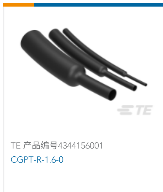
TE 产品编号4344156001 CGPT-R-1.6-0