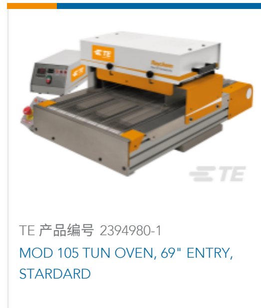
TE 产品编号 2394980-1 MOD 105 TUN OVEN, 69" ENTRY, STANDARD