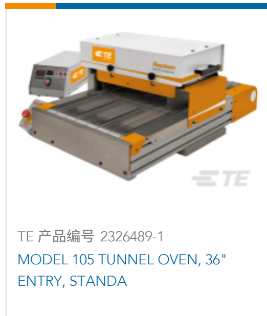
TE 产品编号 2326489-1 MODEL 105 TUNNEL OVEN, 36" ENTRY, STAND