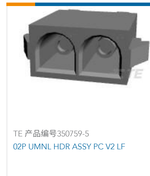
TE 产品编号350759-5 02P UMNL HDR ASSY PC V2 LF