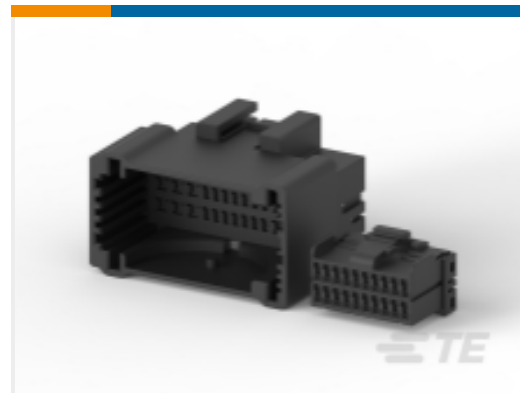
TE 产品编号174922-1 MULTILOCK, 连接器壳体