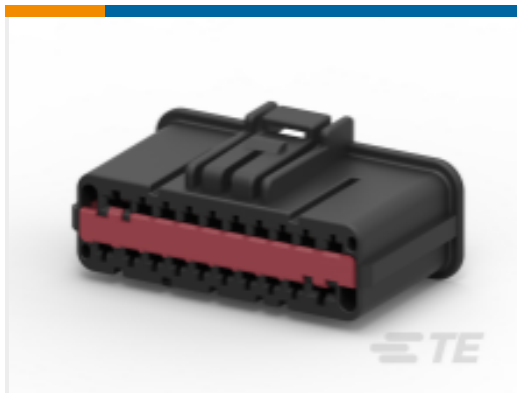
TE 产品编号2098377-1 1.5/2.8 连接器系统, 壳体