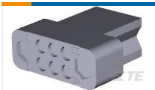
TE 产品编号202758-3 6 PL. BLOCK