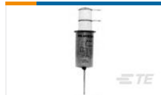
TE 产品编号1-1618239-6 K41A234=RELAY, VACUUM, SPST-NO