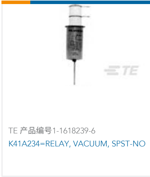
TE 产品编号1-1618239-6 K41A234=RELAY, VACUUM, SPST-NO