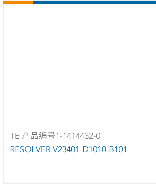
TE 产品编号1-1414432-0 RESOLVER V23401-D1010-B101