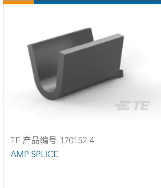
TE 产品编号 170152-4 AMP SPLICE