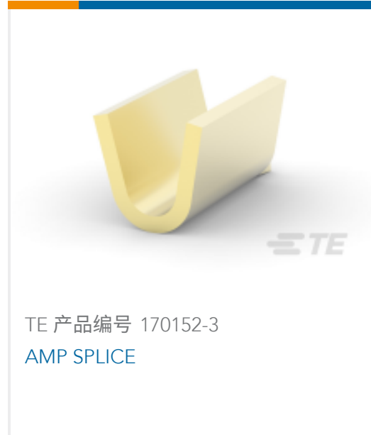
TE 产品编号 170152-3 AMP SPLICE