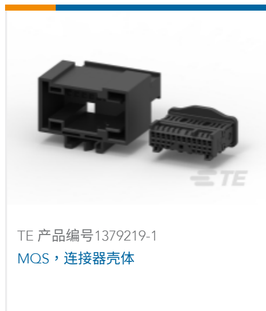
TE 产品编号1379219-1 MQS, 连接器壳体