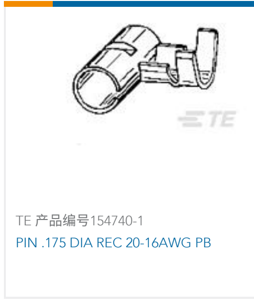
TE 产品编号154740-1 PIN .175 DIA REC 20-16AWG PB