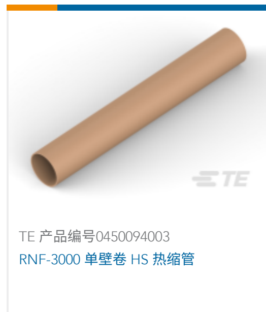
TE 产品编号0450094003 RNF-3000 单壁卷 HS 热缩管