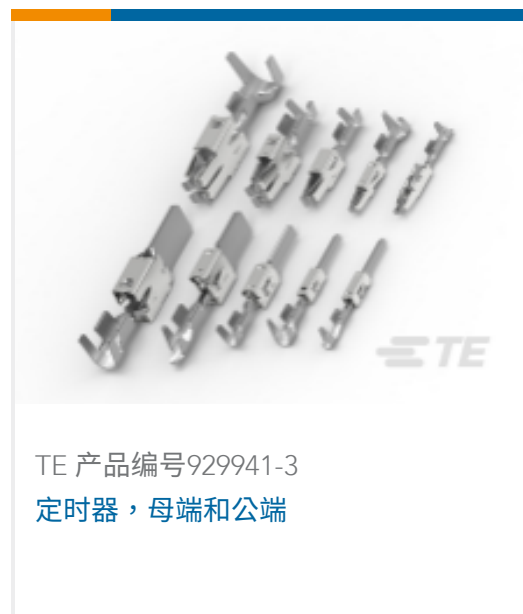
TE 产品编号929941-3 定时器, 母端和公端