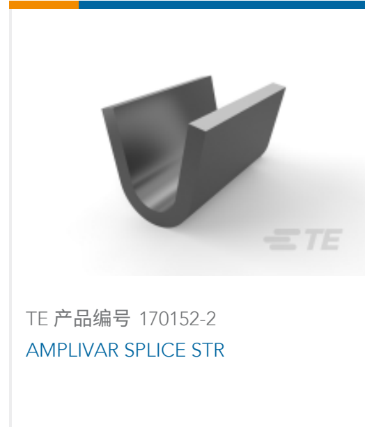
TE 产品编号 170152-2 AMPLIVAR SPLICE STR